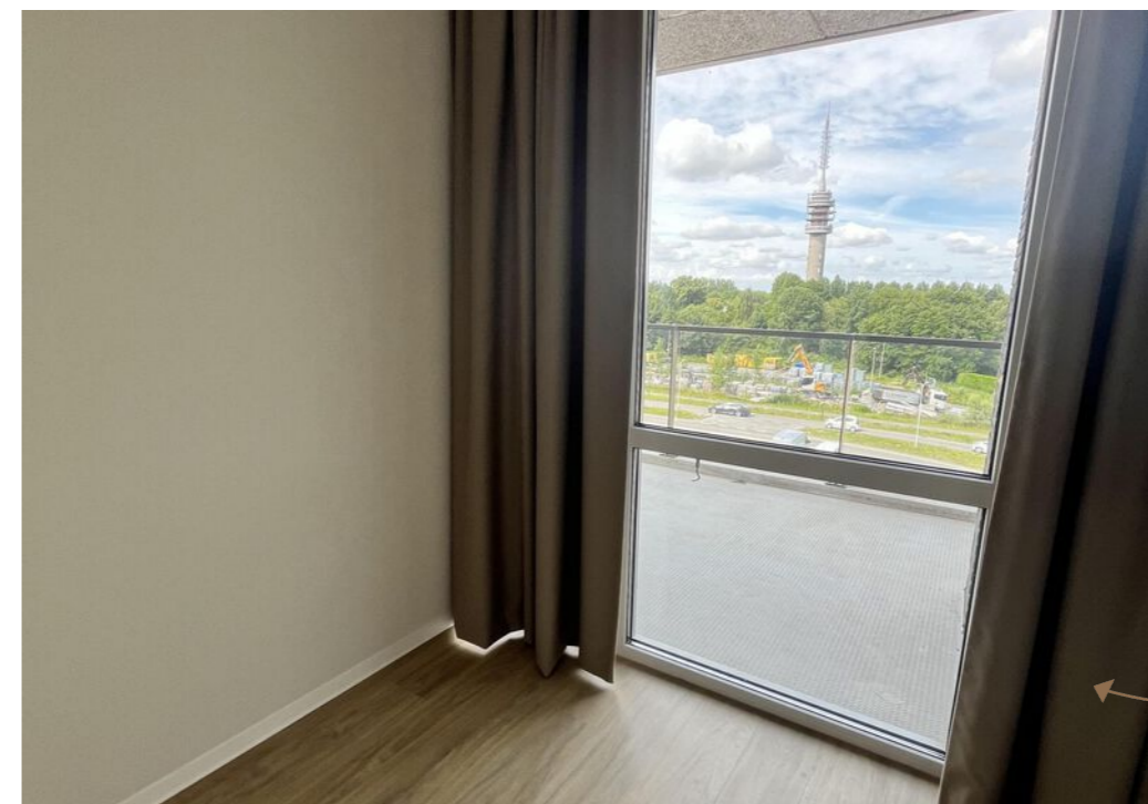
Het mooie uitzicht met groot balkon van 11m 2