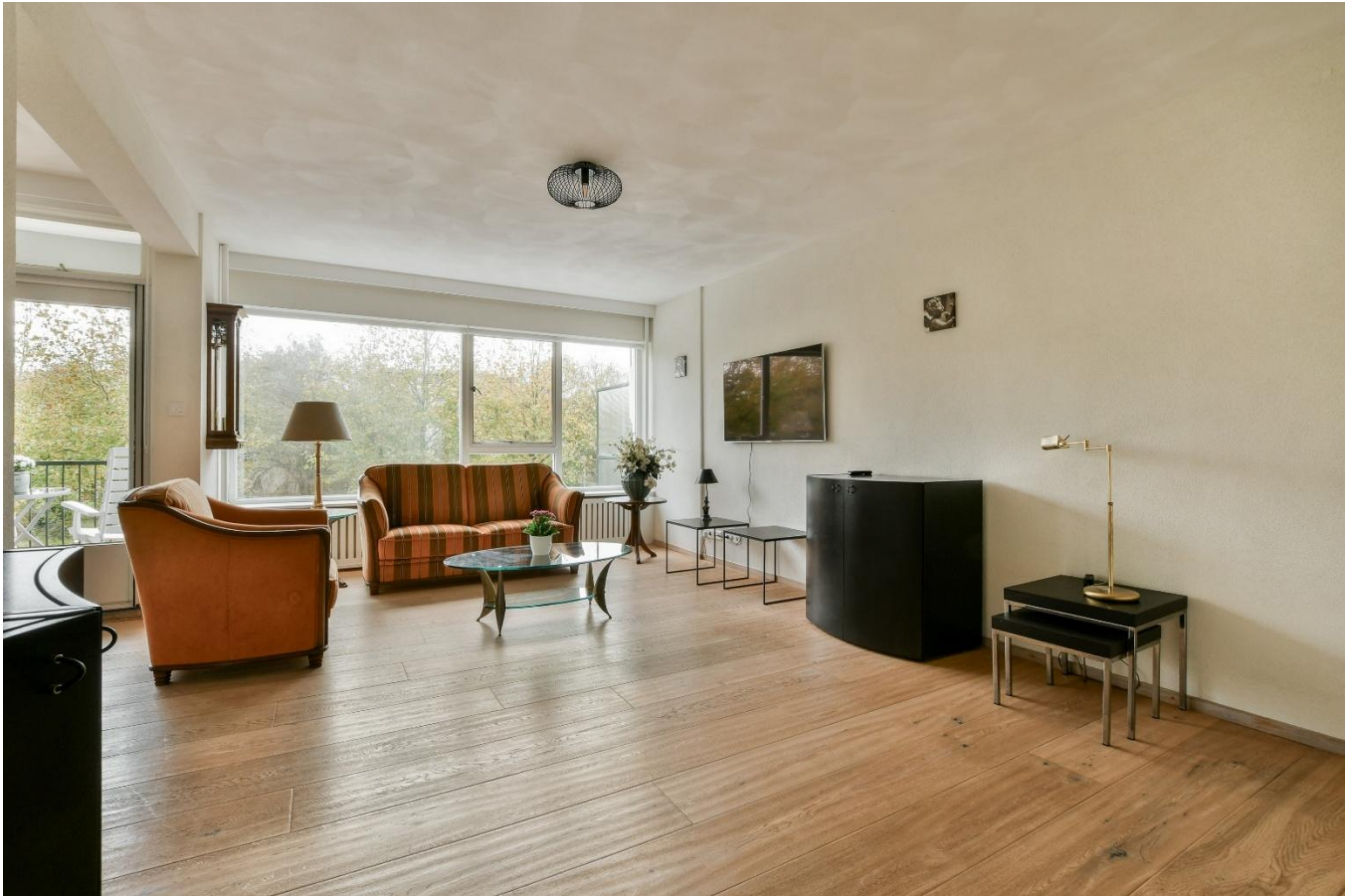
Heerlijke lichte woonkamer met veel raampartijen.