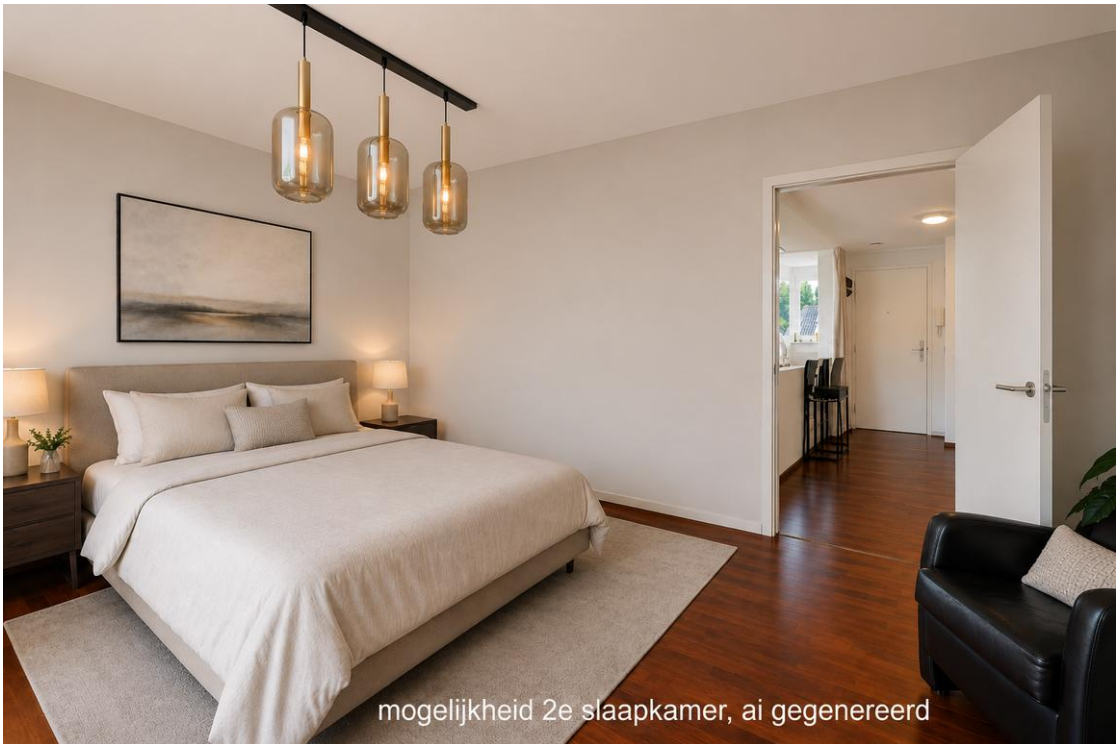
mogelijkheid 2e slaapkamer, ai gegenereerd