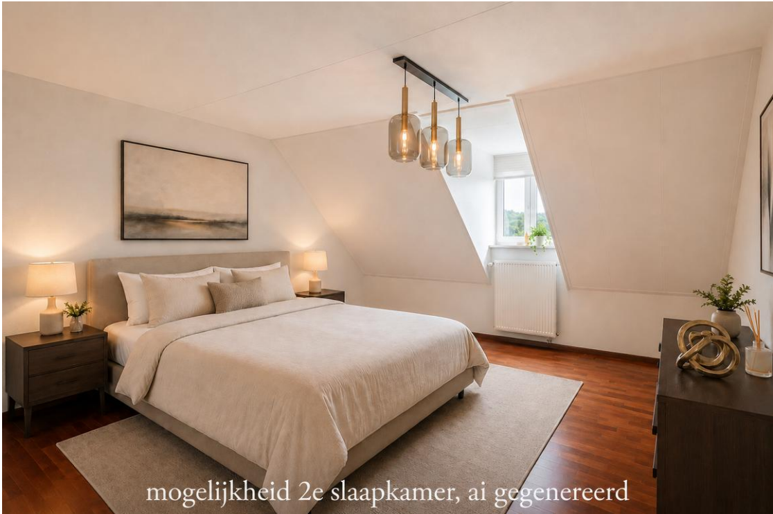
mogelijkheid 2e slaapkamer, ai gegenereerd