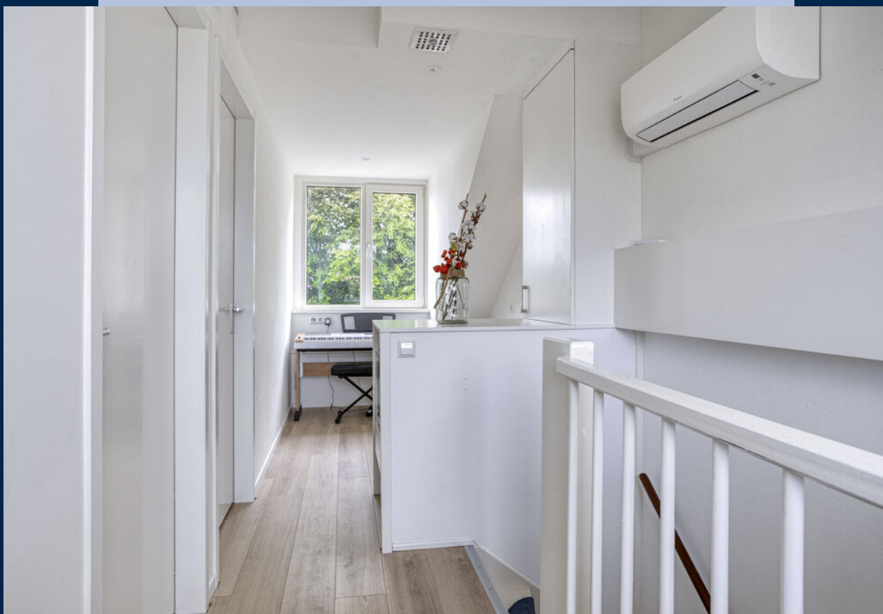
Recent verbouwde zolderverdieping met twee kunststof dakkapellen. Deze verdieping is zeer fraai te noemen.