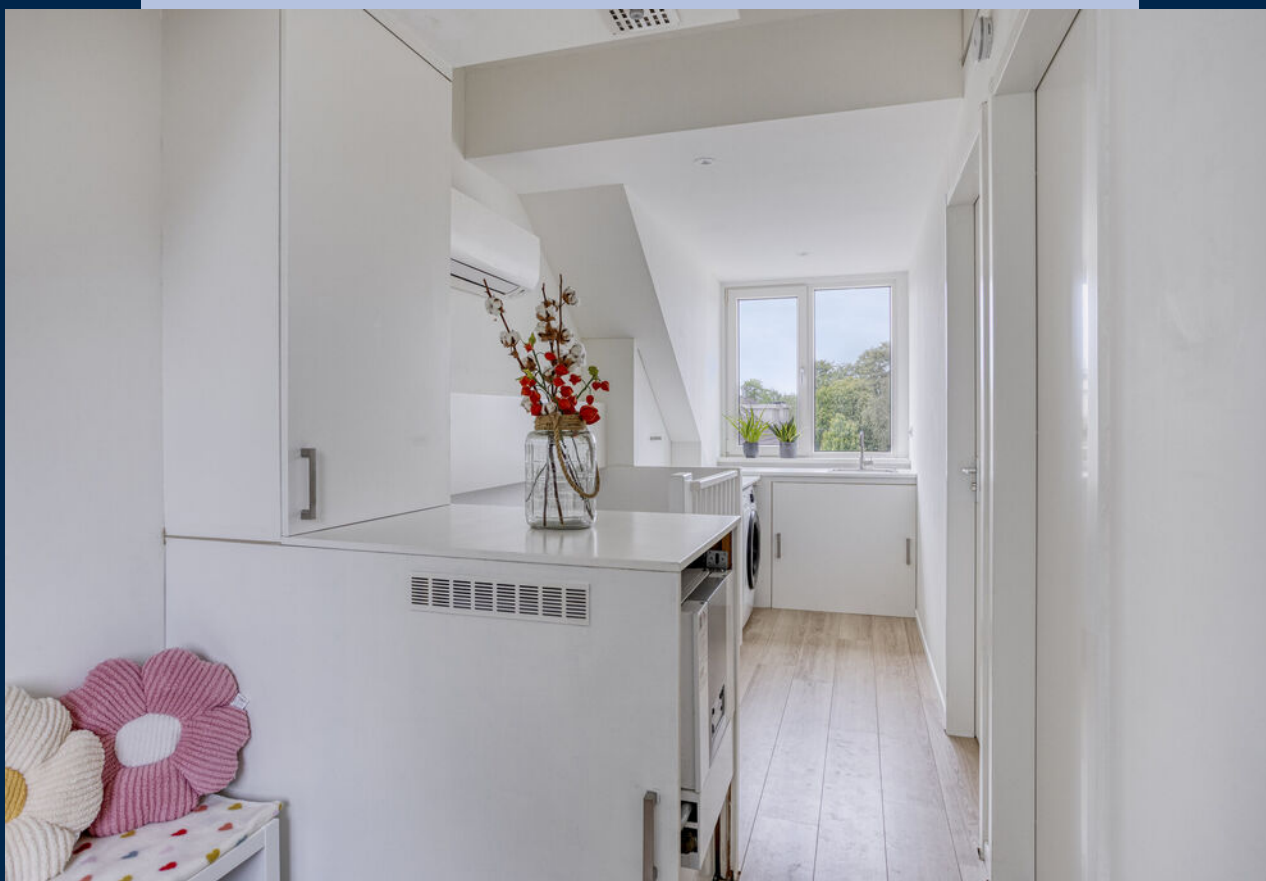
De tweede verdieping heeft een grote voorzolder met airconditioning, aansluiting voor wasmachine -/droger en twee ruim bemeten slaapkamers met eveneens een laminaatvloer.