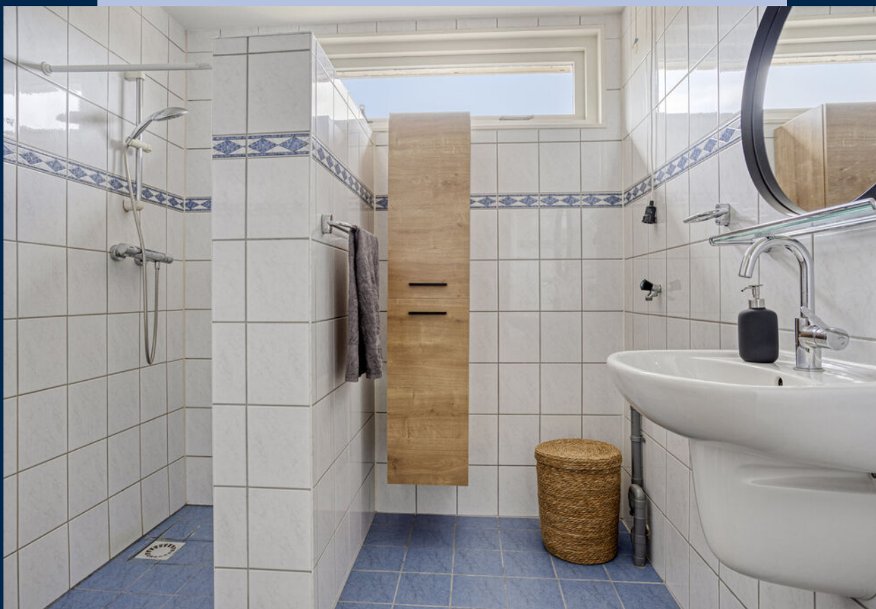
De badkamer heeft een douche, wastafel en tweede toilet.