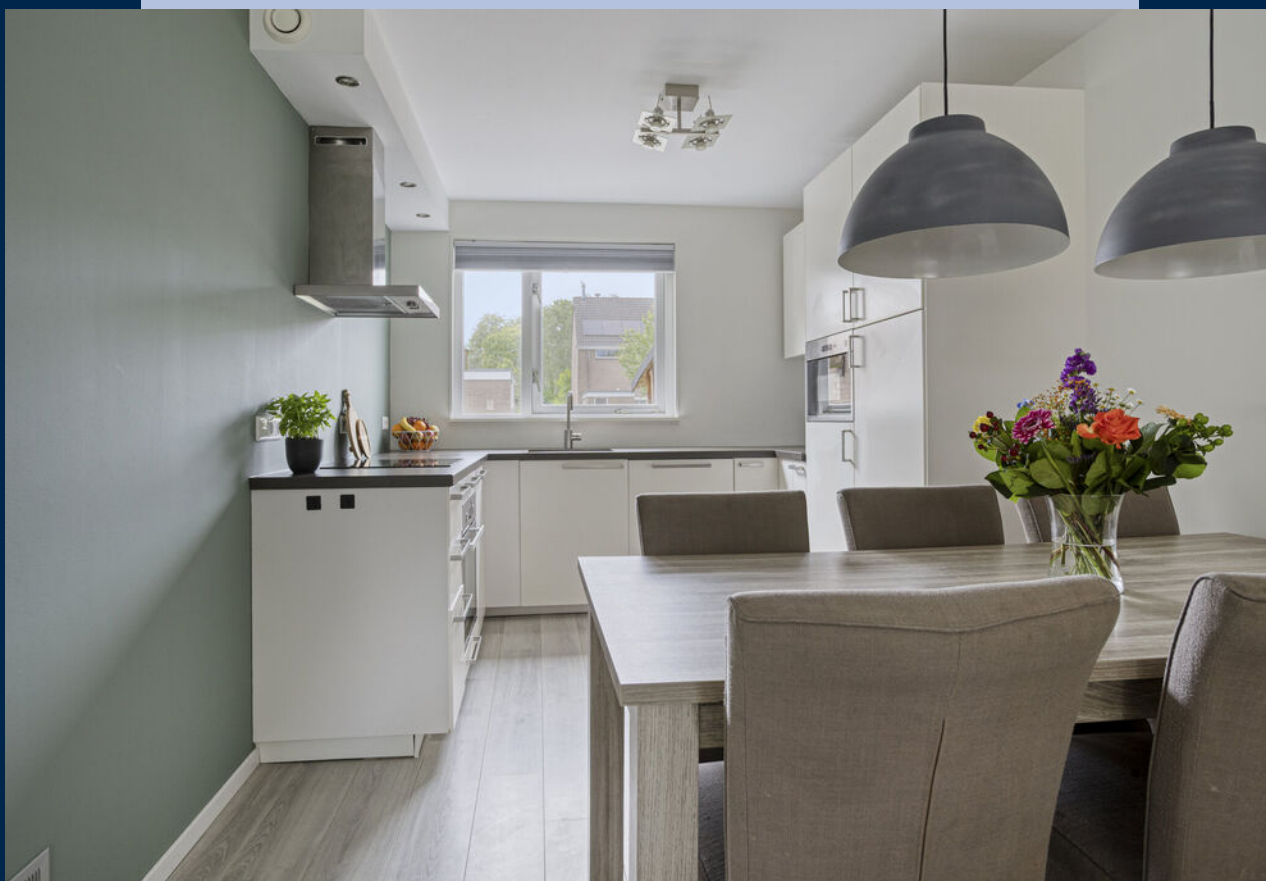
De moderne keuken (2018) aan de voorzijde is voorzien van een inductie kookplaat, afzuigkap, koelkast, vriezer, oven, magnetron en vaatwasmachine.