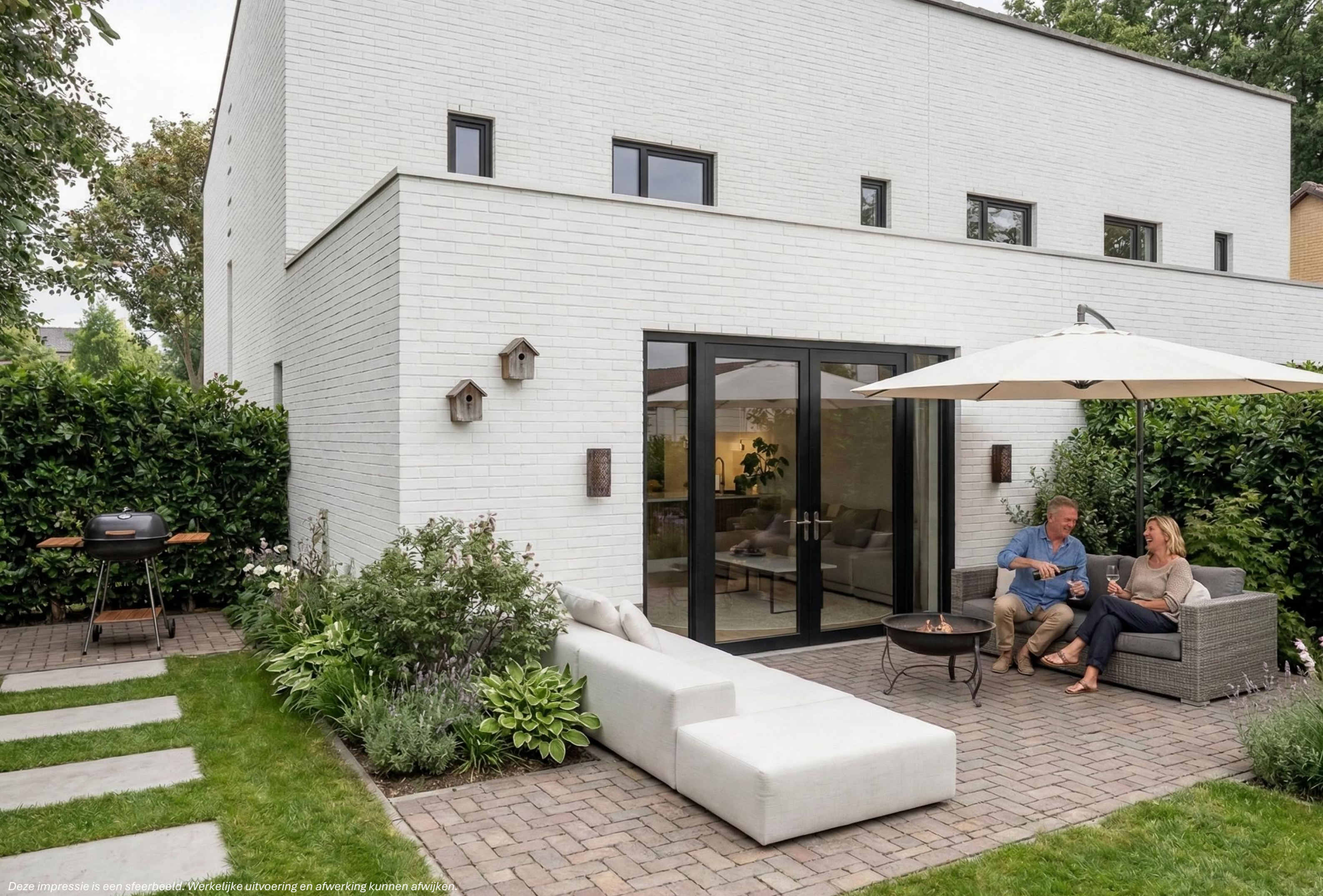
Deze impressie is een sfeerbeeld. Werkelijke uitvoering en afwerking kunnen afwijken.