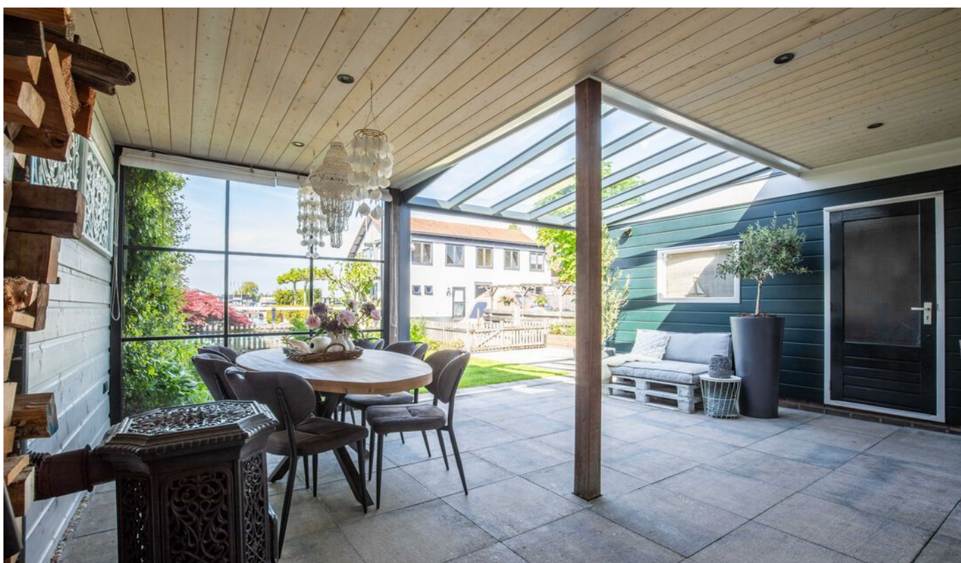
Achtertuint met tuinkamer