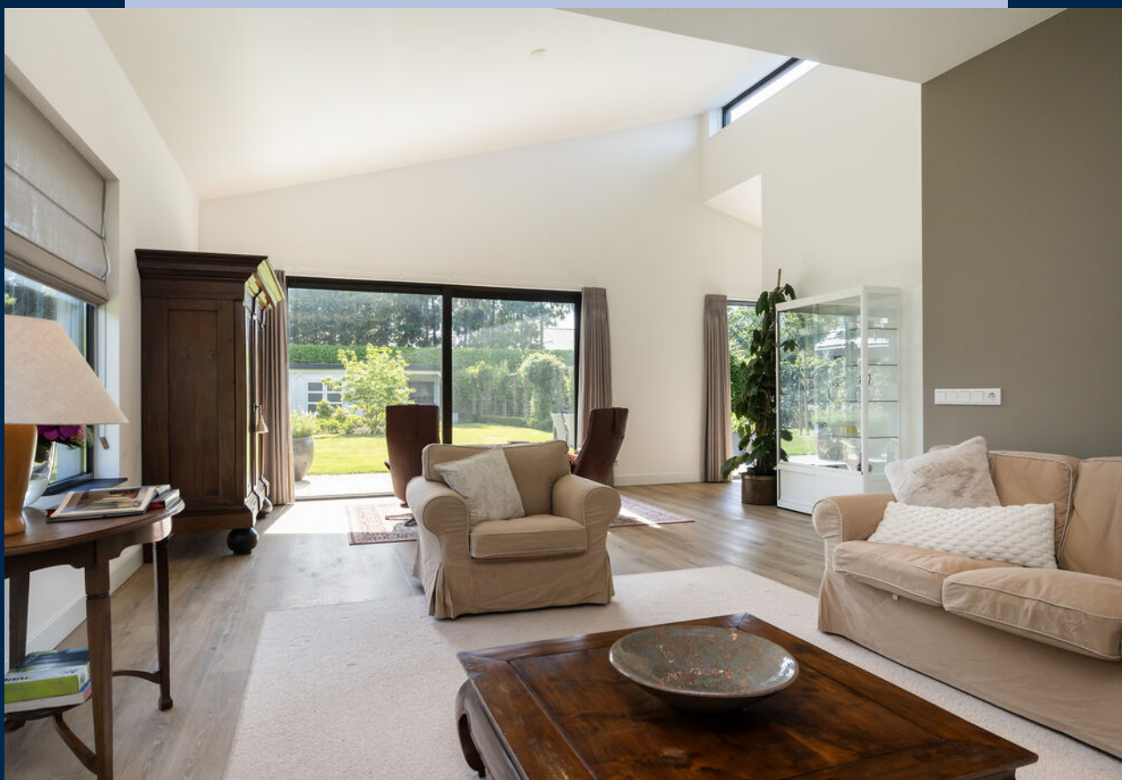
Het hart van het huis is de royale woonkamer met PVC-vloer en de moderne open keuken.