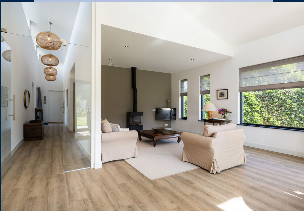
Het betreft een lichte leefruimte waar de dag prettig begint en eindigt.