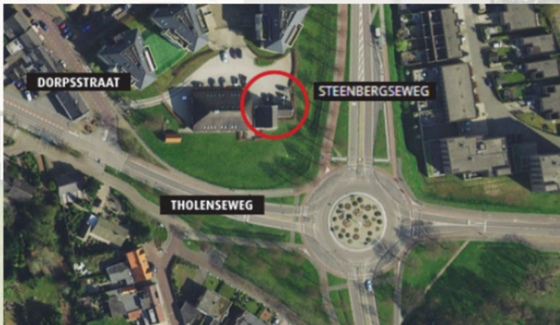
Ons kantoor bevindt zich in het woonhuis van boerderij 't Lindeke in Halsteren.