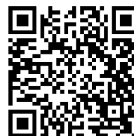
Ron Kabalt Financieel adviseur AMB Hypotheken

Voor het plannen van een gratis hypotheekscan met één van onze adviseurs kunt u terecht op www.ambhypotheken.nl . Of scan de QR code en vul het formulier in op onze website.