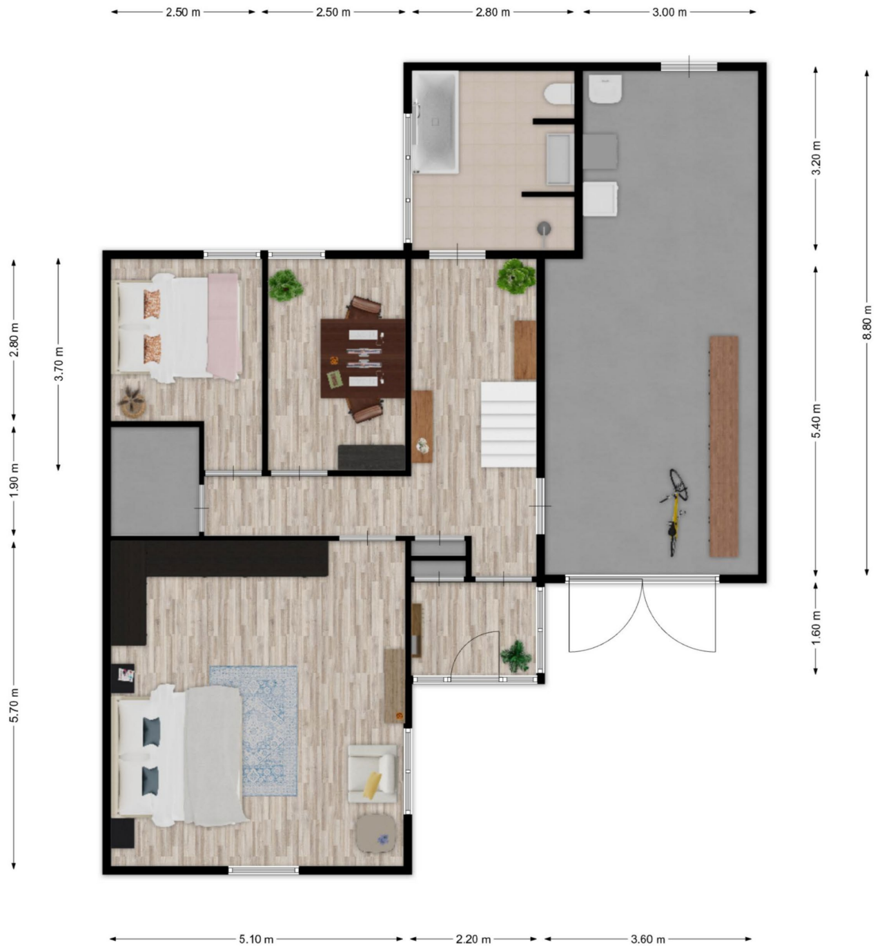
Bergse heihoeck 6 te Berghem - Begane grond Plattegronden zijn ter indicatie. Aan de maatvoering en indeling kunnen geen rechten worden ontleend.

Plattegronden zijn ter illustratie en kunnen op bepaalde punten enigszins afwijken van de werkelijkheid.