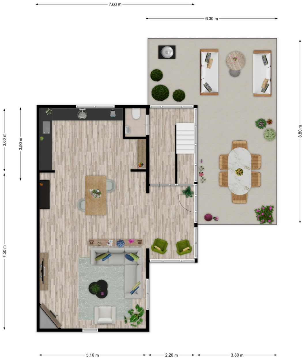
Bergse heilhoek 6 te Berghem - Eerste verdieping Plattegronden zijn ter indicatie. Aan de maatvoering en indeling kunnen geen rechten worden ontleend.

Plattegronden zijn ter illustratie en kunnen op bepaalde punten enigszins afwijken van de werkelijkheid.