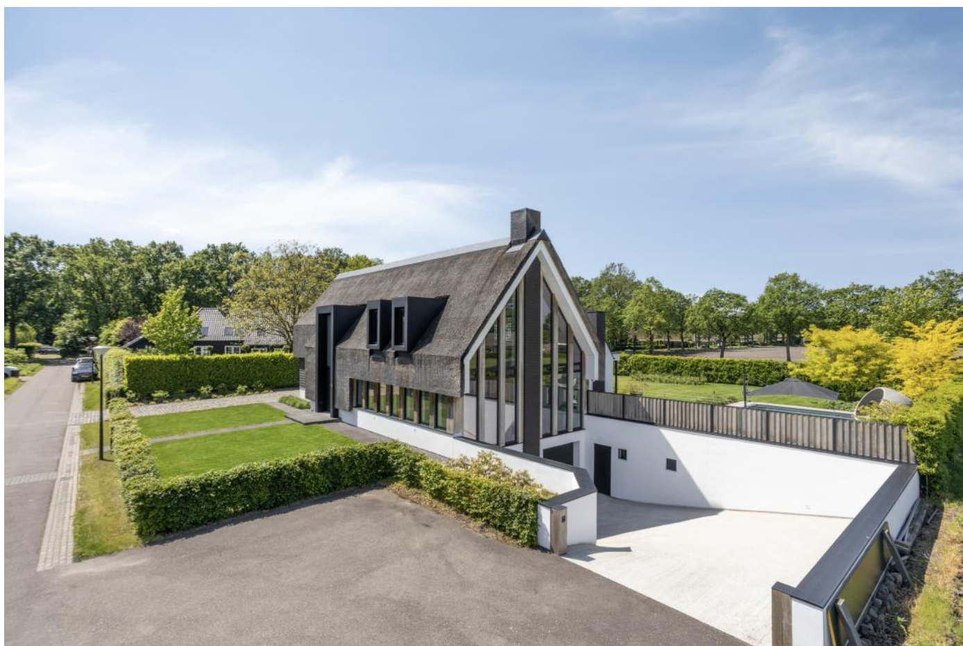
Voor- en zijgevel met inrit naar parkeerkelder/souterrain