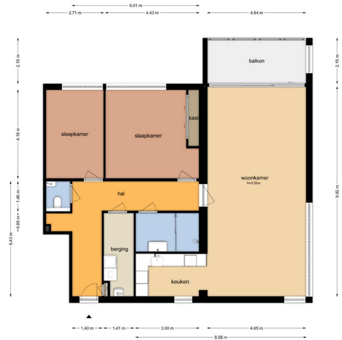
Esdoornlaan 5 - Beilen Begane Grond

De plattegronden zijn geproduceerd voor promotionele doeleinden en ter indicatie. Aan de plattegronden kunnen geen rechten worden ontleend. © www.objectenoo.nl