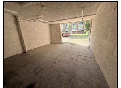
Colenbranderstraat, 5624 Eindhoven