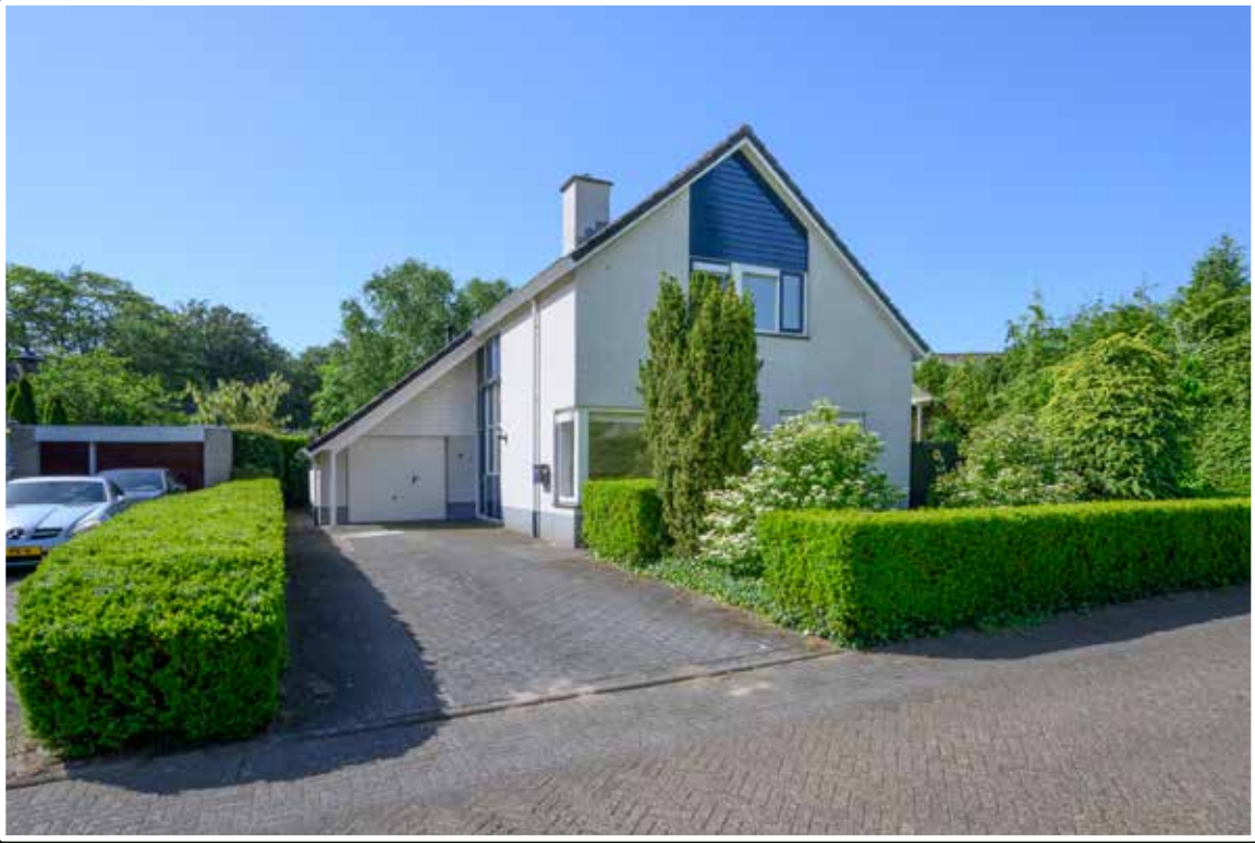
Brummen Rhiender Es 2