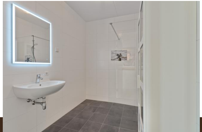
Abcoudermeer 43 Abcoude