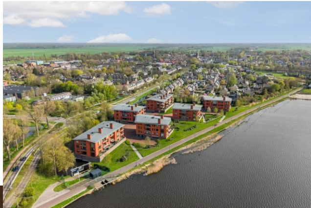
Abcoudermeer 43 Abcoude