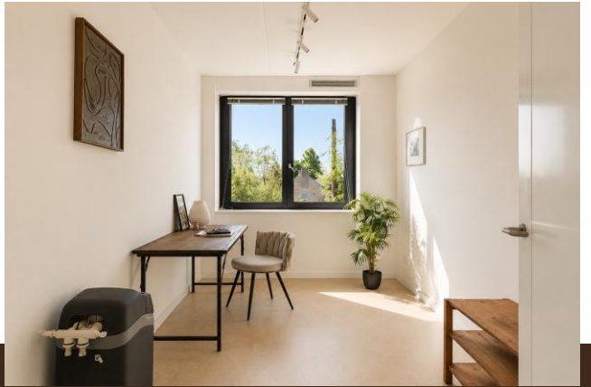
Abcoudermeer 43 Abcoude