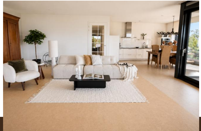
Abcoudermeer 43 Abcoude