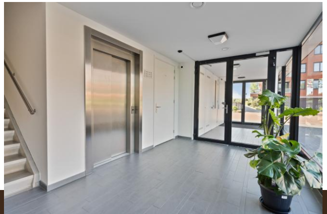
Abcoudermeer 43 Abcoude