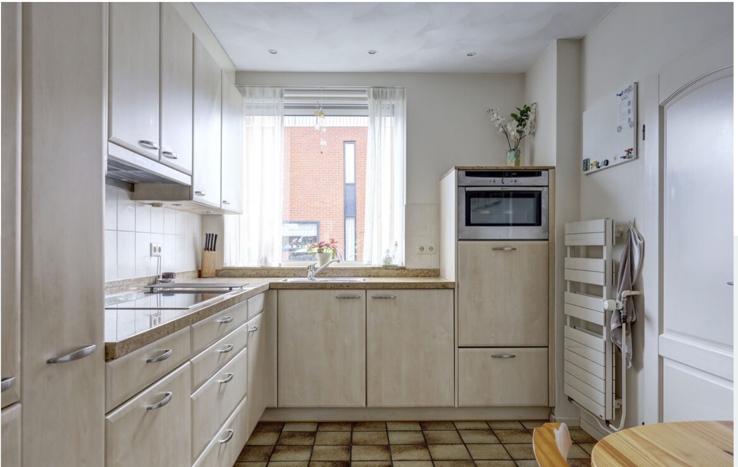
Entree, toilet, bijkeuken en keuken