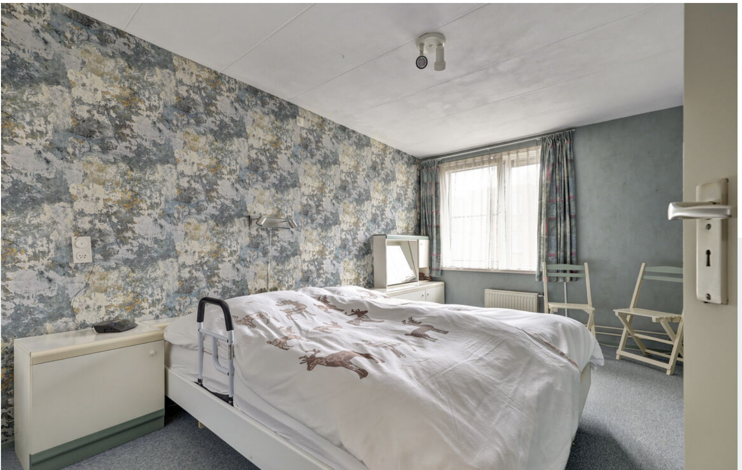
Slaapkamers 1e verdieping