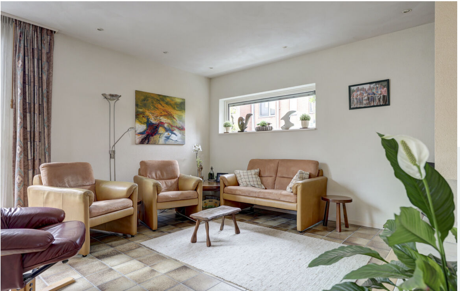
Woonkamer en eetkamer