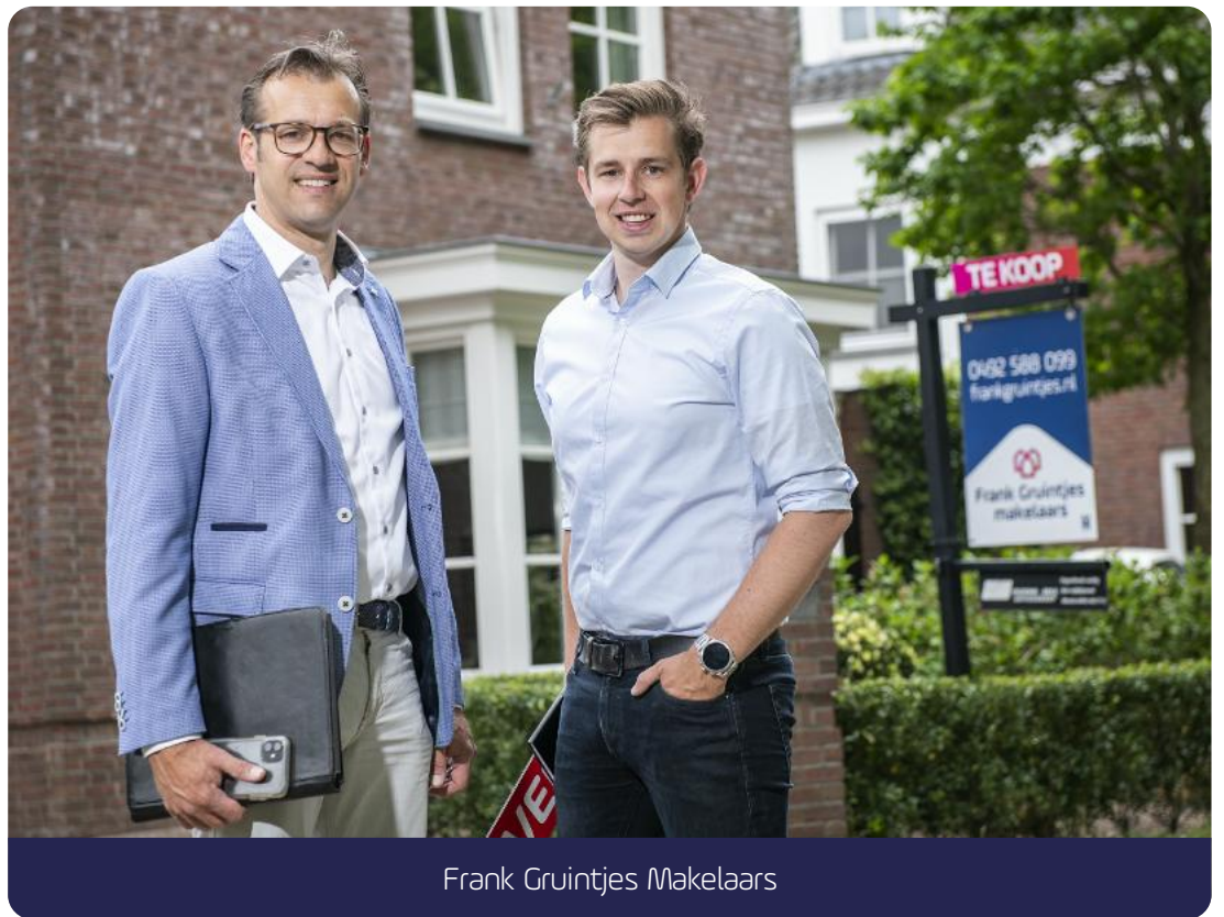
Frank Gruintjes Makelaars