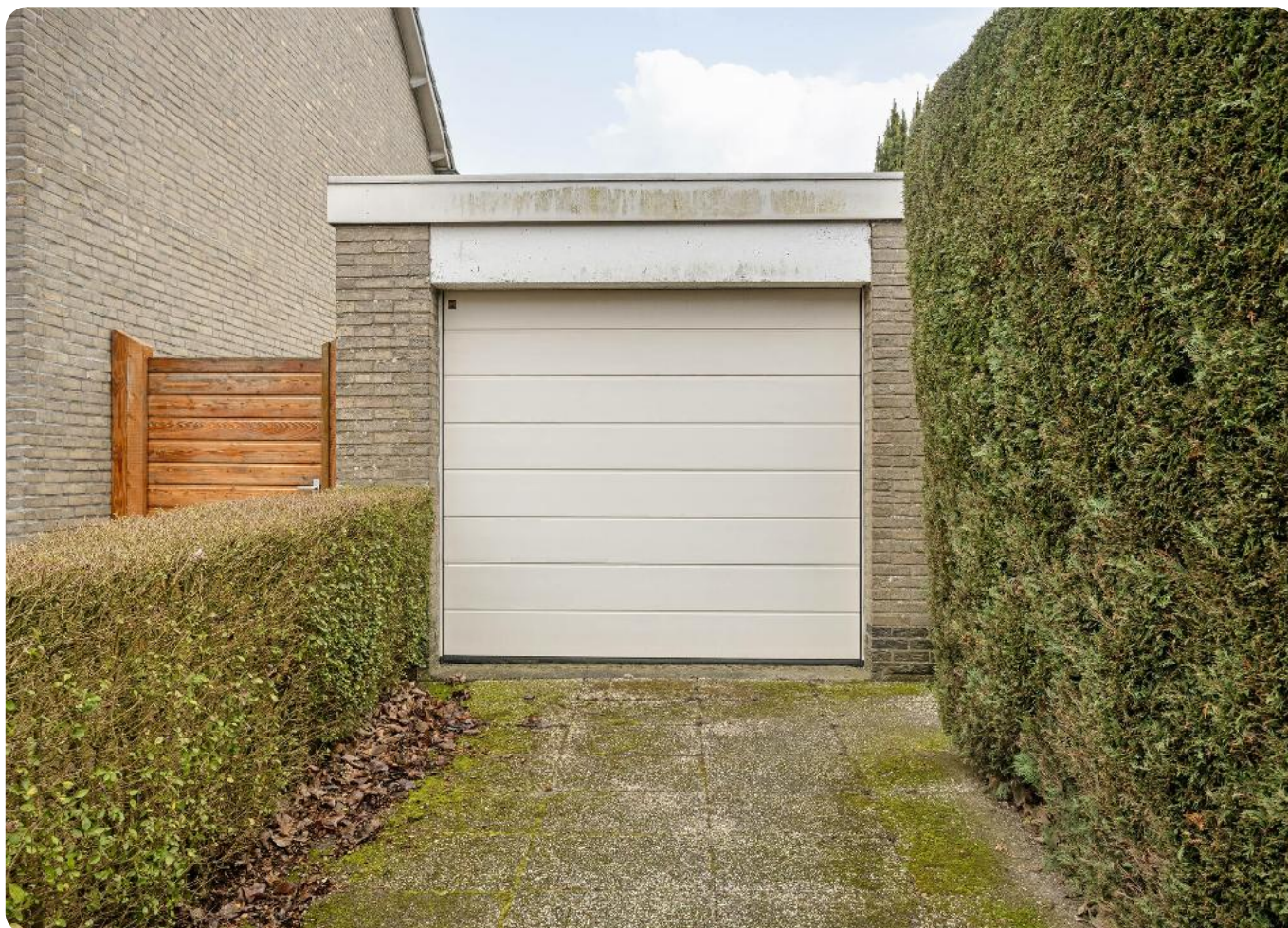
Schoolstraat 8, te Mierlo