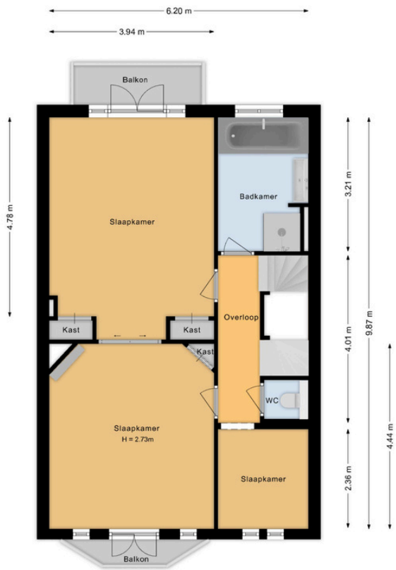
Laan van Bloemenhove 3 Heemstede 1e Verdieping

Deze plattegrond is met de grootst mogelijke zorg samengesteld. Desondanks kunnen er geen rechten aan worden ontleend en kunnen er kleine afwijking zijn in de exacte maatvoering. www.agvastgoedmedia.nl