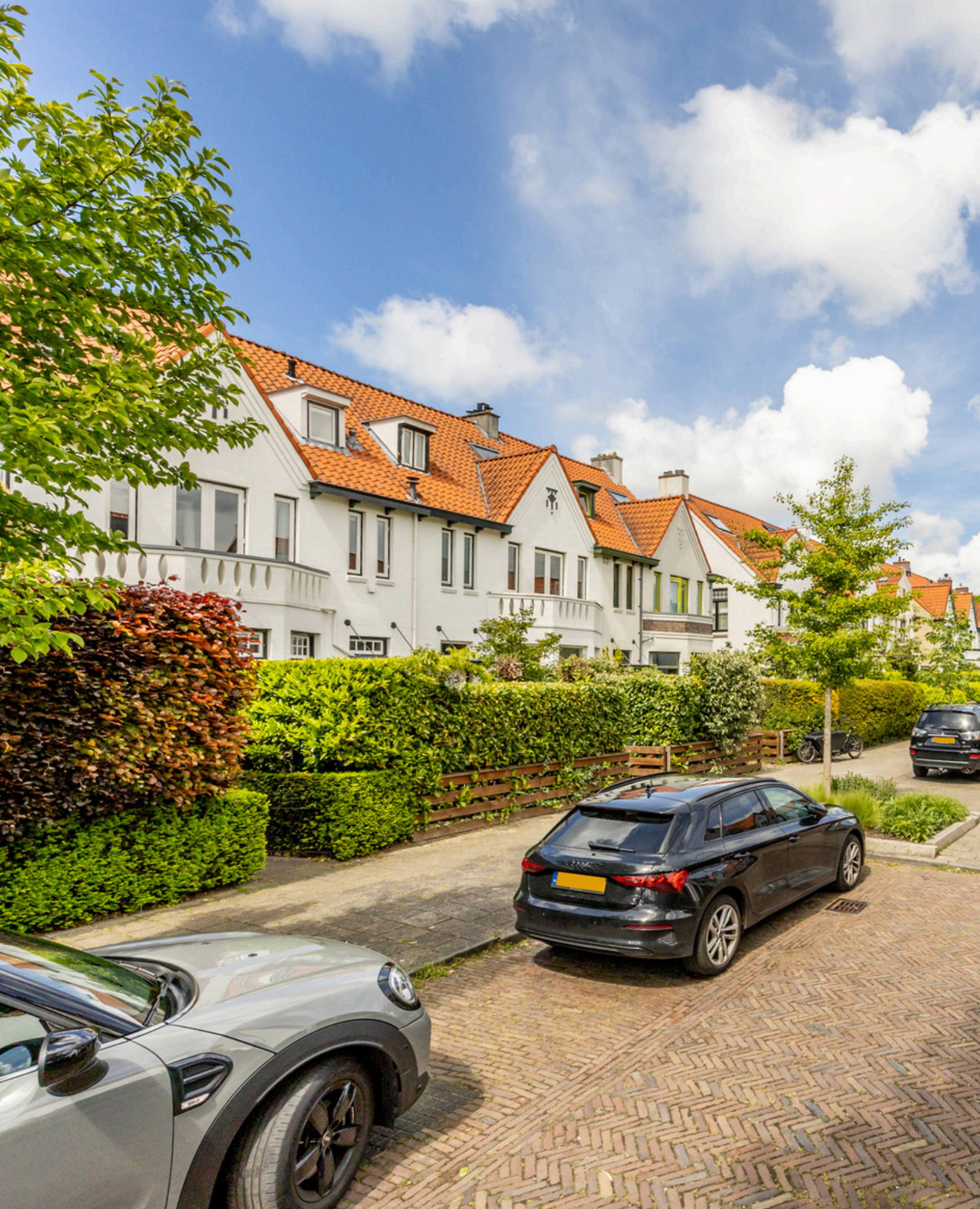
Laan van Bloemenhove 3, Heemstede