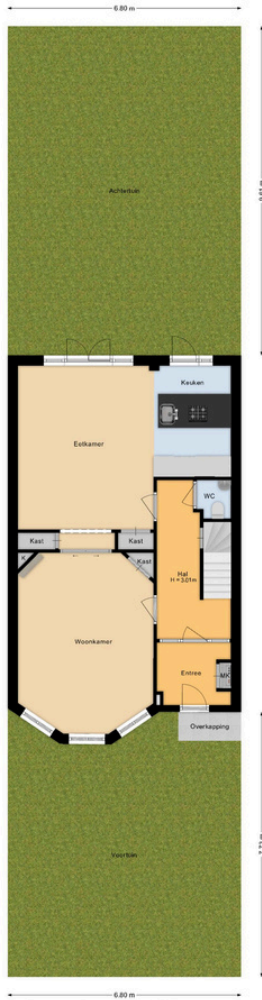
Laan van Bloemenhove 3 Heemstede Situatie

Deze plattegrond is met de grootst mogelijke zorg samengesteld. Desondanks kunnen er geen rechten aan worden ontleend en kunnen er kleine afwijking zijn in de exacte maatvoering. www.agvastgoedmedia.nl