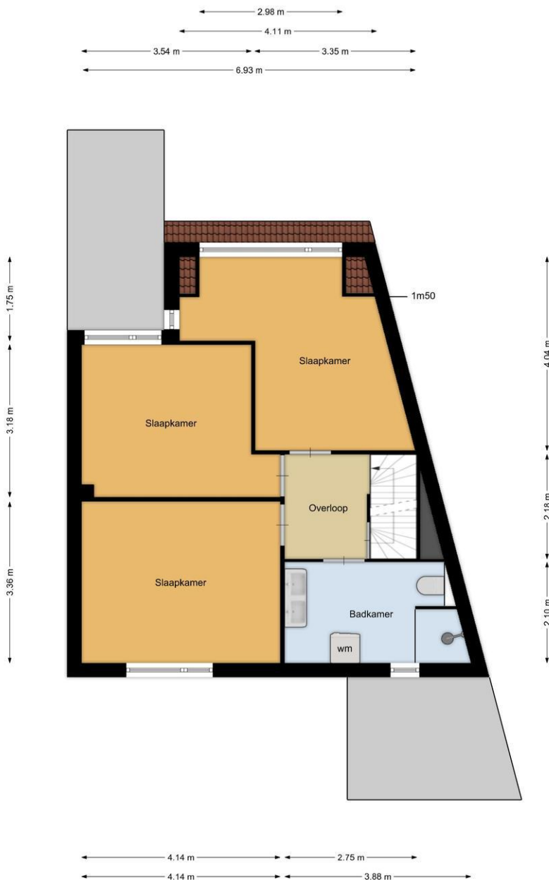
De Brik 13, Baarn 1e verdieping

De plattegronden zijn geproduceerd voor promotionele doeleinden en ter indicatie. Aan de plattegronden kunnen geen rechten worden ontleend.