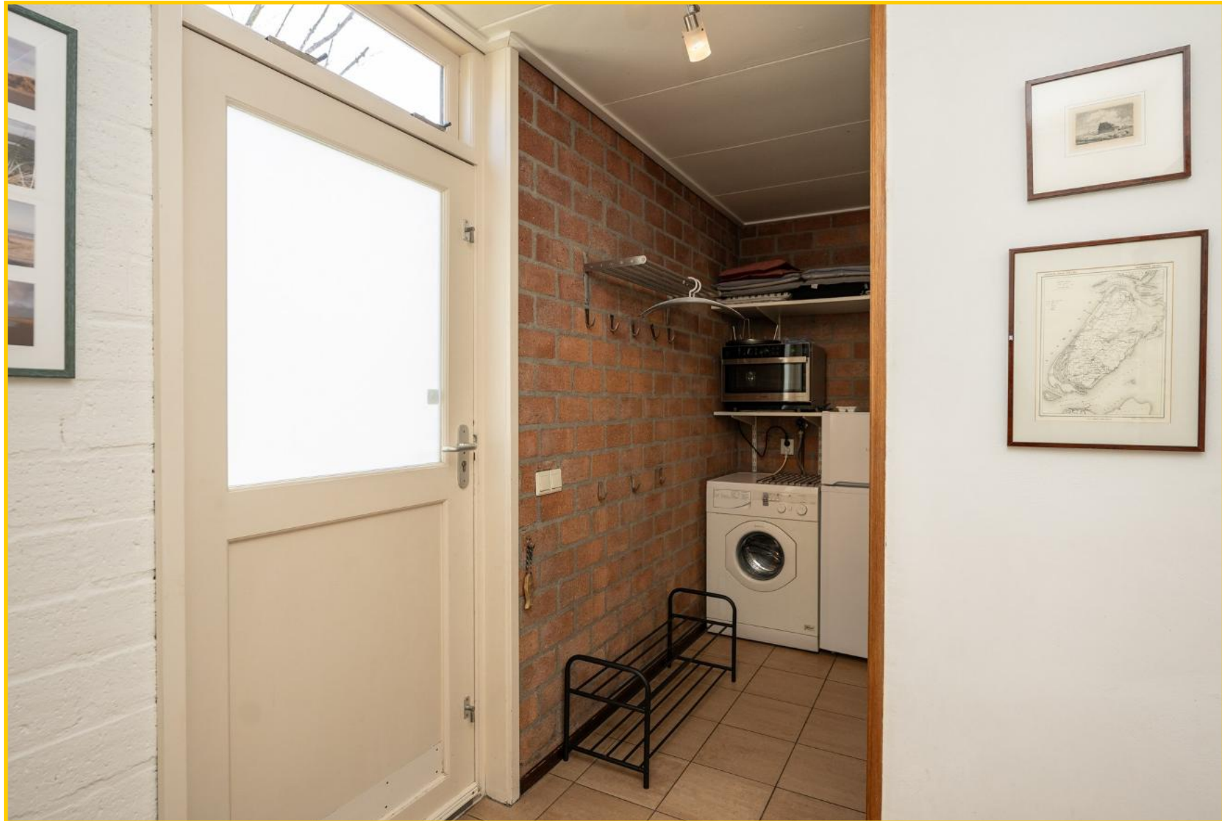
Aangrenzend aan de hal bevindt zich de berging. Hier treft u de opstelplaats voor de wasmachine, de cv-ketel en een extra koel-vriescombinatie.