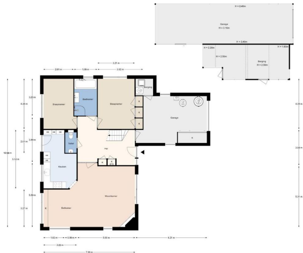
Groeneveld 1B, De Lier | Begane grond H = 2.56 m