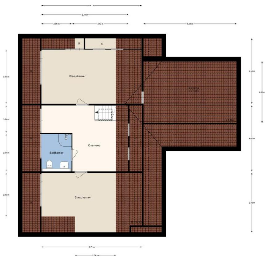
Groeneveld 1B, De Lier | 1e verdieping H = 2.90 m