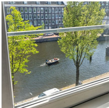
Houtmankade 74-3 - Amsterdam Tweede Verdieping