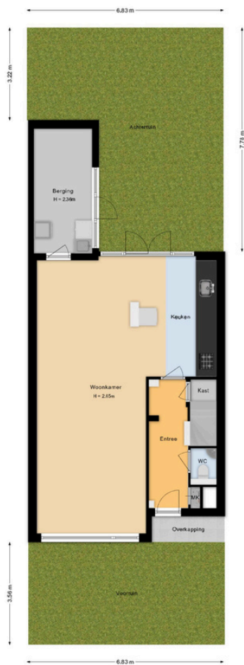
Franz Lehárlaan 72 Heemstede Situatie

Deze plattegrond is met de grootst mogelijke zorg samengesteld. Desondanks kunnen er geen rechten aan worden ontleend en kunnen er kleine afwijking zijn in de exacte maatvoering. www.agvastgoedmedia.nl