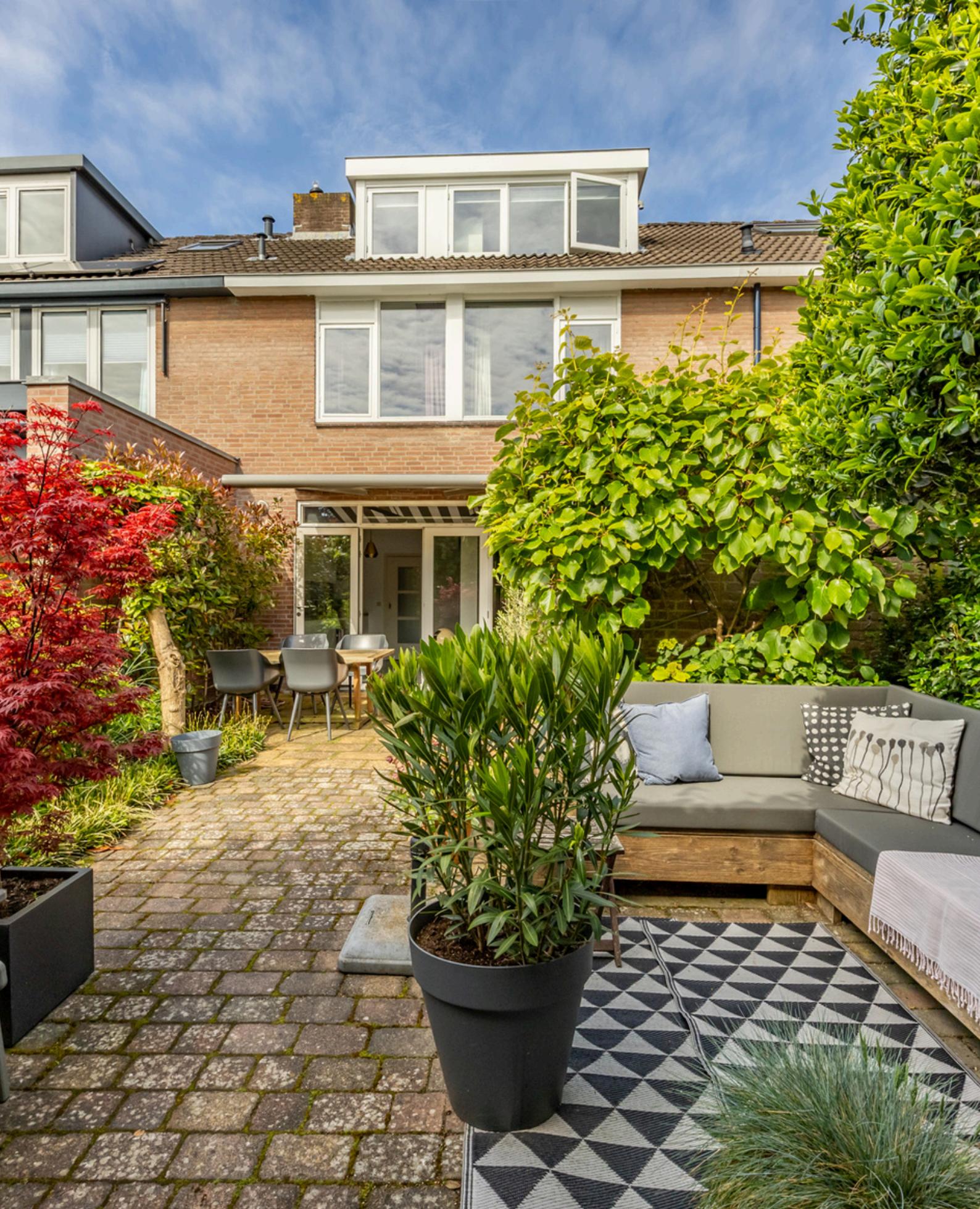
Franz Léharlaan 72, Heemstede