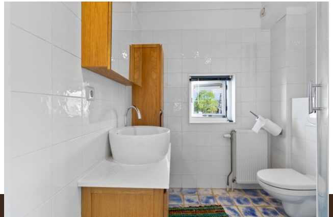
Vinkenkade 77 R25 Vinkeveen