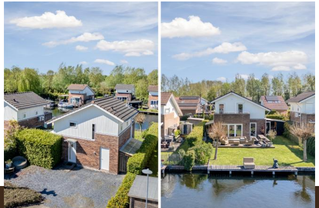
Vinkenkaide 77 R25 Vinkeveen