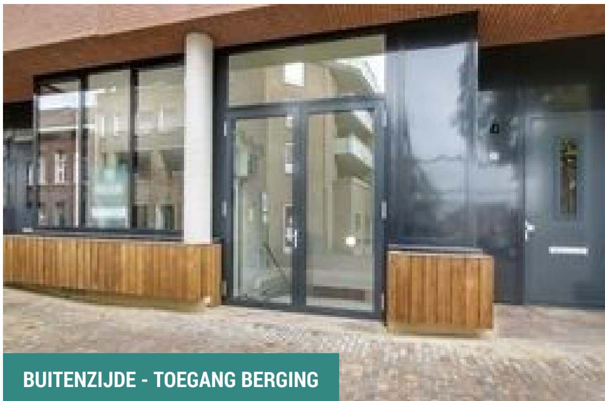
BUITENZIJDE - TOEGANG BERGING