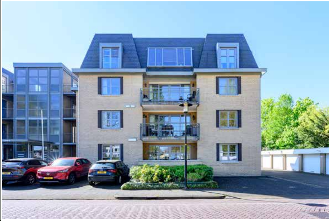
Brummen Burgemeester Dekkerstraat 6