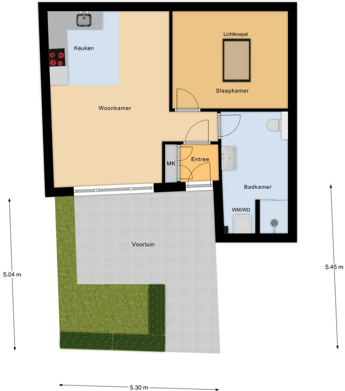
Begane Grond Tuin