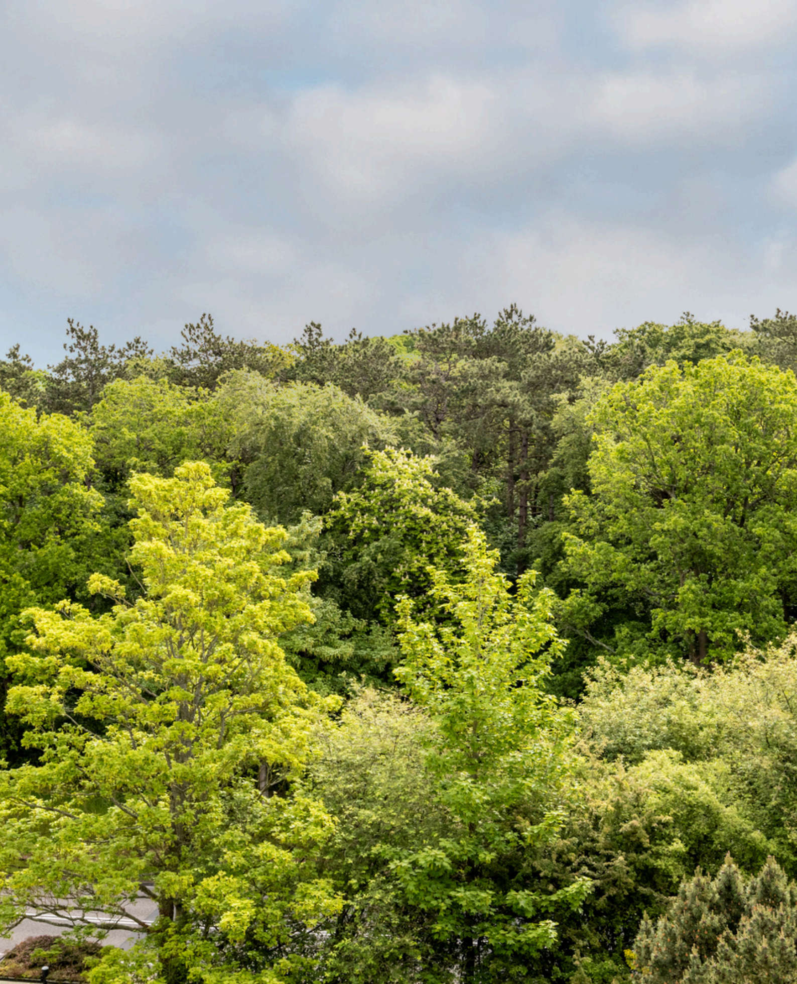
Merwedeplantsoen 100, Heemstede