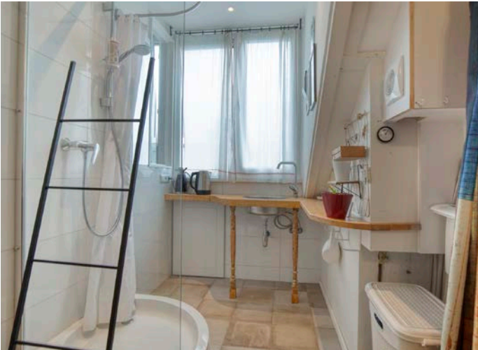
Relaxen in bad