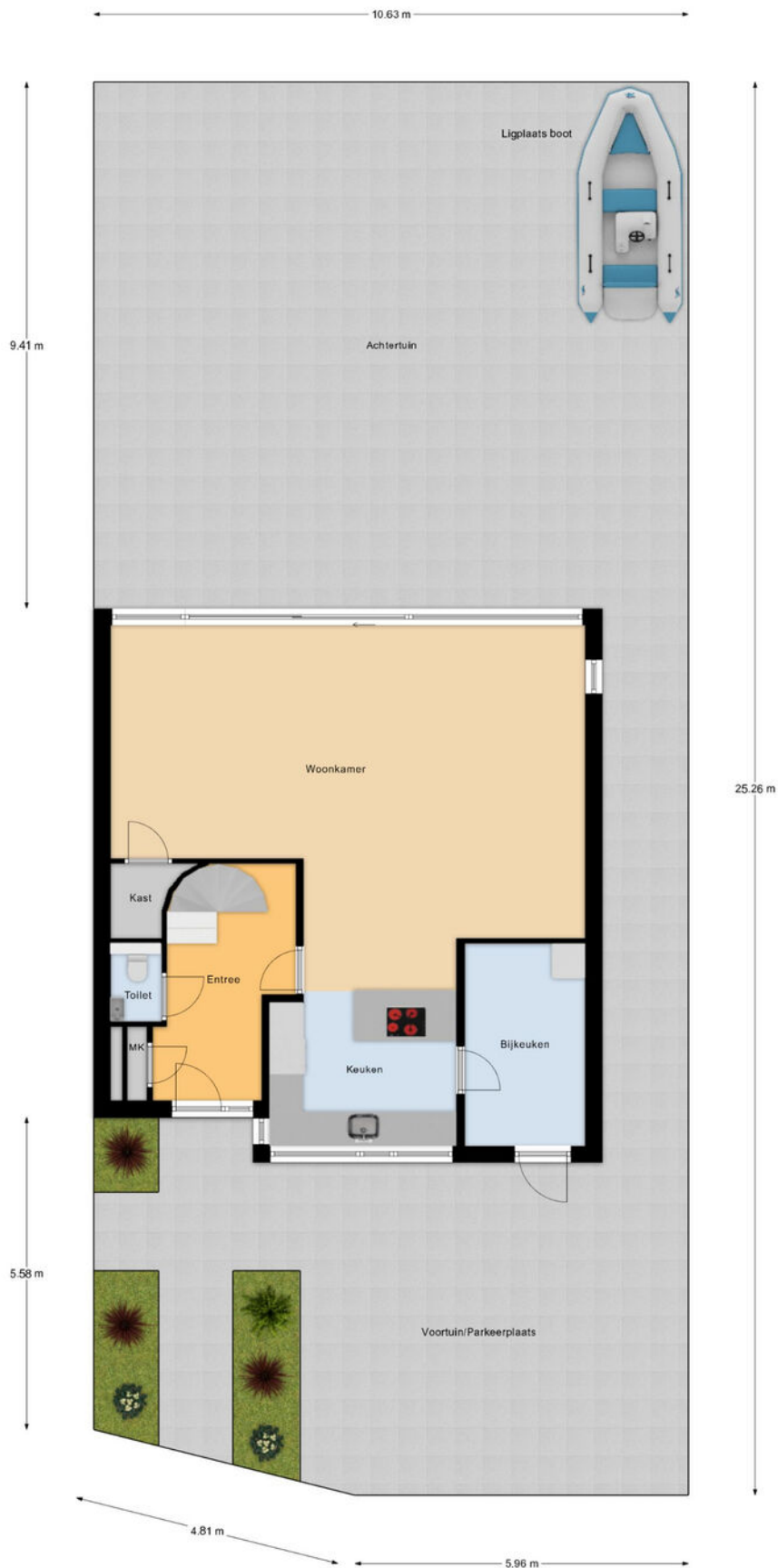
Begane Grond Tuin