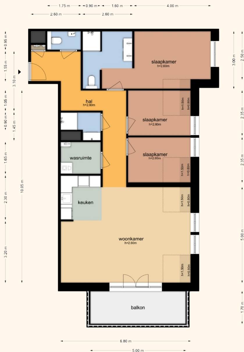
Boulevard de Wielingen 9-14 - Cadzand Derde Verdieping

De plattegronden zijn geproduceerd voor promotionele doeleinden en ter indicatie. Aan de plattegronden kunnen geen rechten worden ontleend.