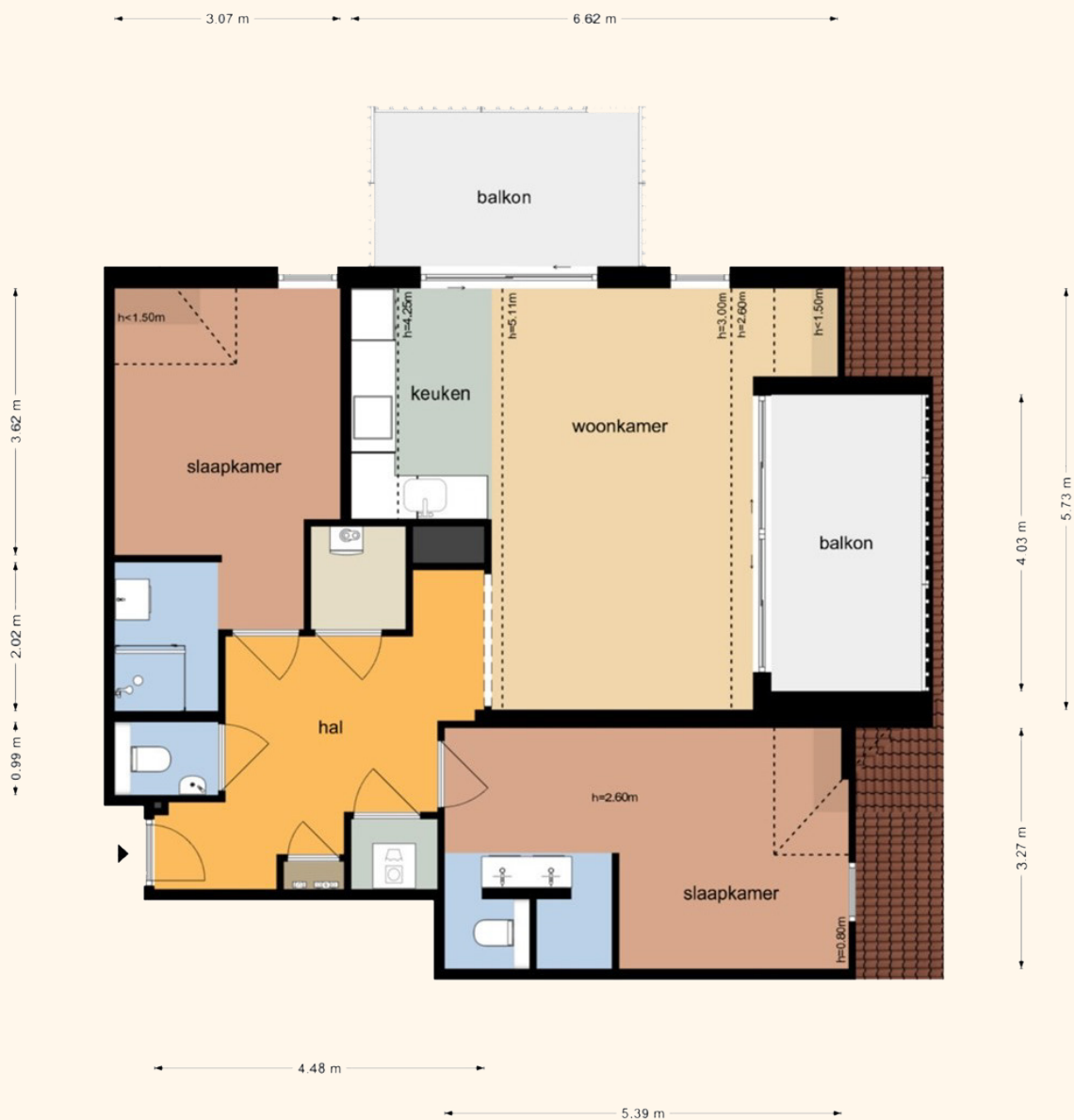
Vlamingpolderweg 4-E301 - Cadzand Derde Verdieping

De plattegronden zijn geproduceerd voor promotionele doeleinden en ter indicatie. Aan de plattegronden kunnen geen rechten worden ontleend. © www.obiectenco.nl