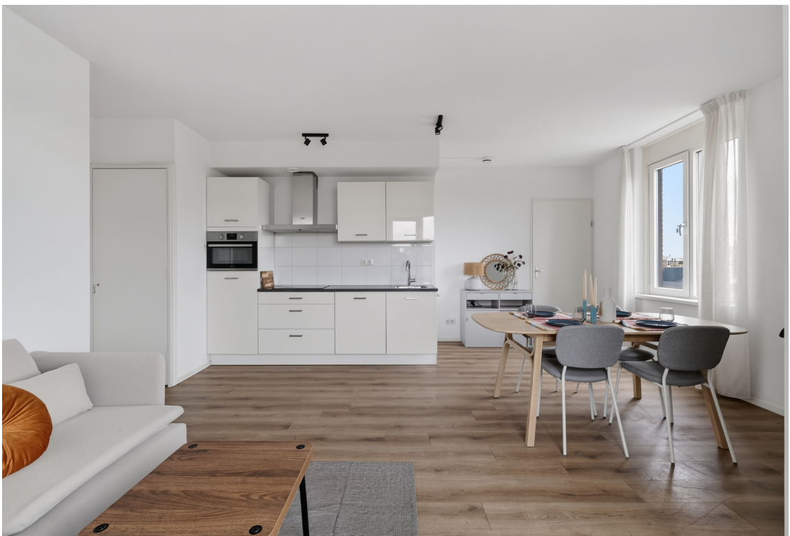
Graaf Janstraat 22, Beverwijk