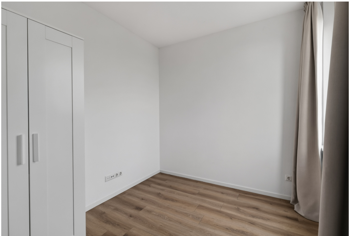
Graaf Janstraat 22, Beverwijk