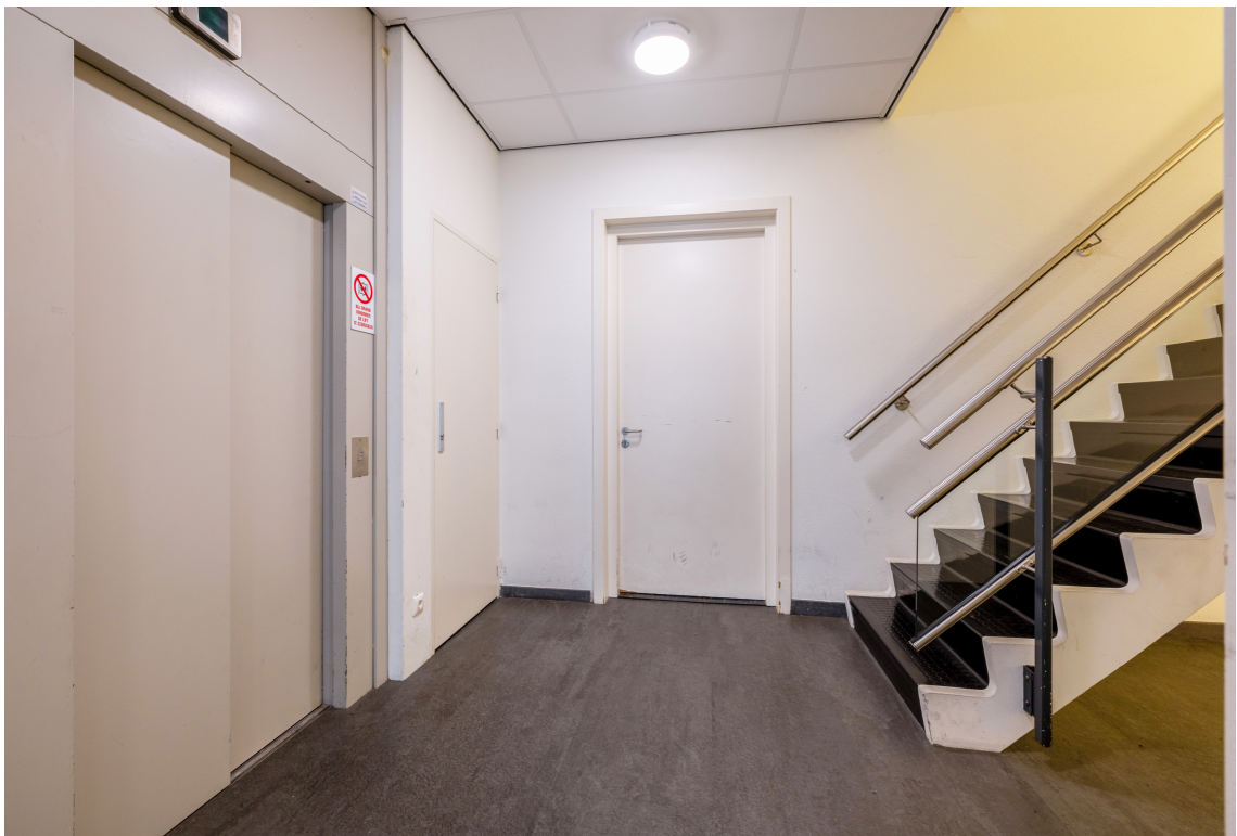
Graaf Janstraat 22, Beverwijk