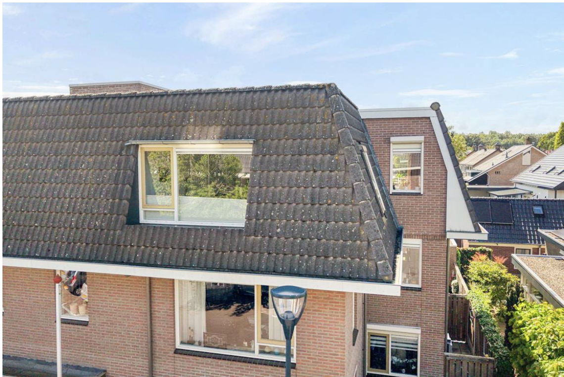
Woertheweg 3e te Hellendoorn