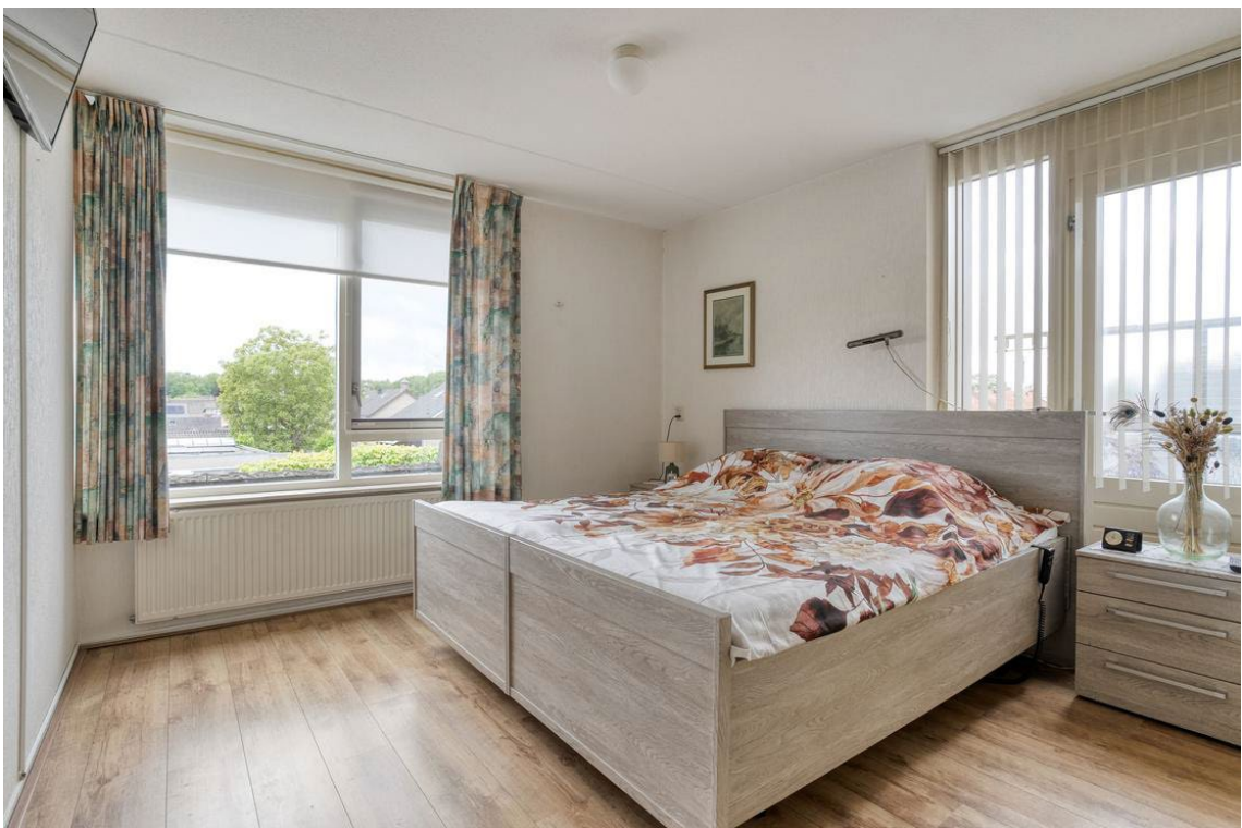
Woertheweg 3e te Hellendoorn