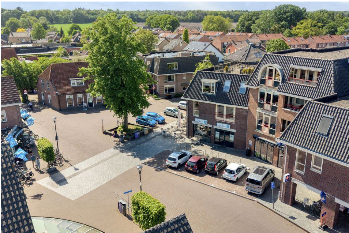
Woertheweg 3e te Hellendoorn