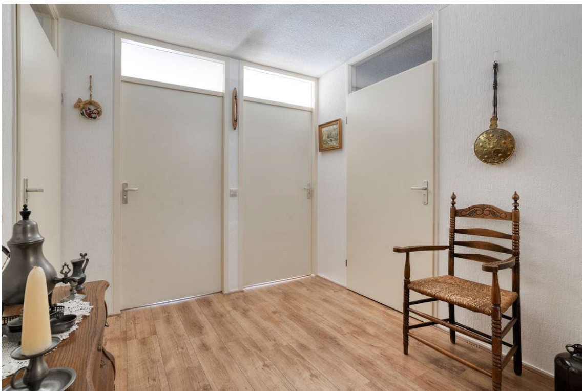
Woertheweg 3e te Hellendoorn