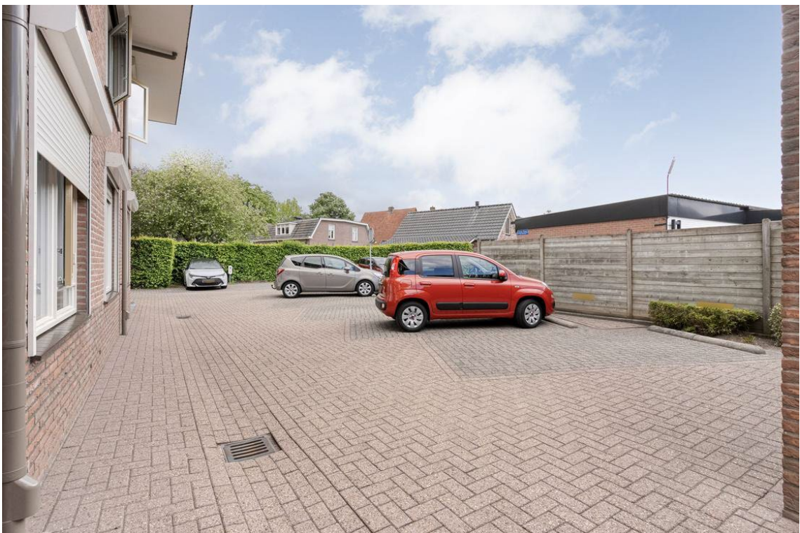
Woertheweg 3e te Hellendoorn