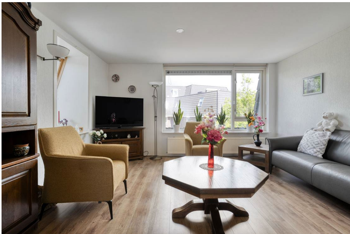
Woertheweg 3e te Hellendoorn