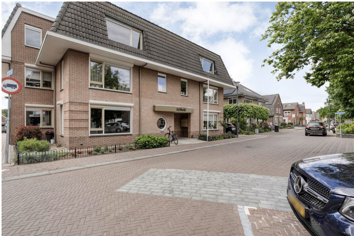
Woertheweg 3e te Hellendoorn