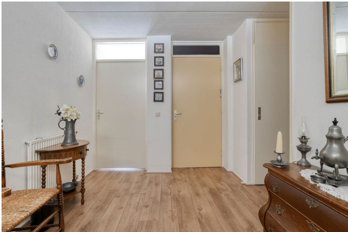
Woertheweg 3e te Hellendoorn