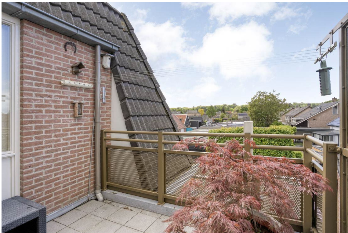
Woertheweg 3e te Hellendoorn