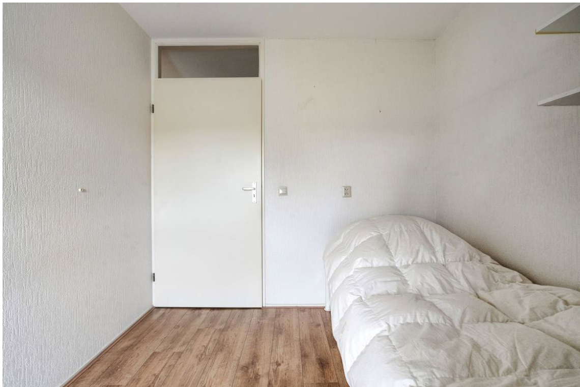
Woertheweg 3e te Hellendoorn