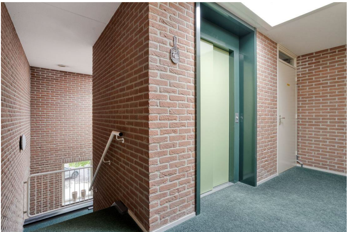
Woertheweg 3e te Hellendoorn