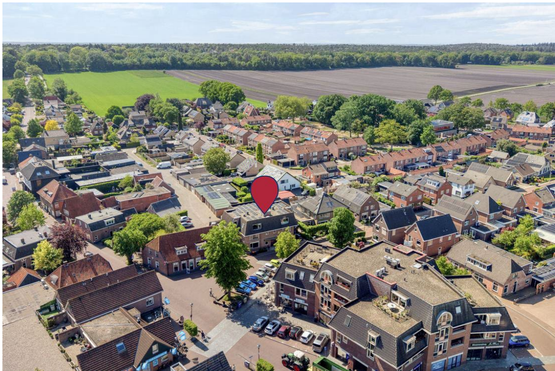
Woertheweg 3e te Hellendoorn