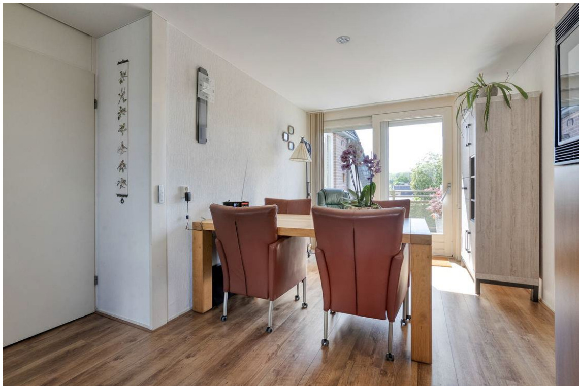
Woertheweg 3e te Hellendoorn