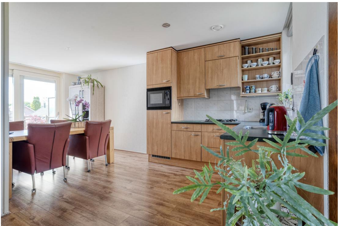
Woertheweg 3e te Hellendoorn