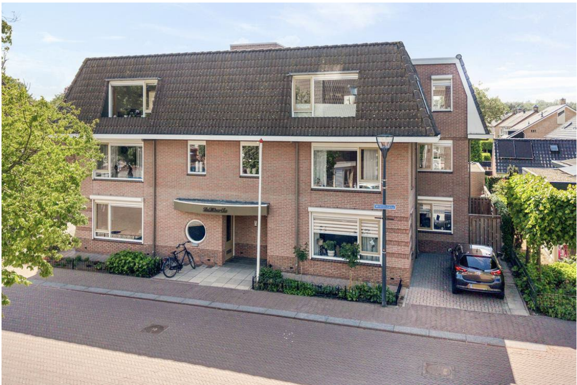
Woertheweg 3e te Hellendoorn