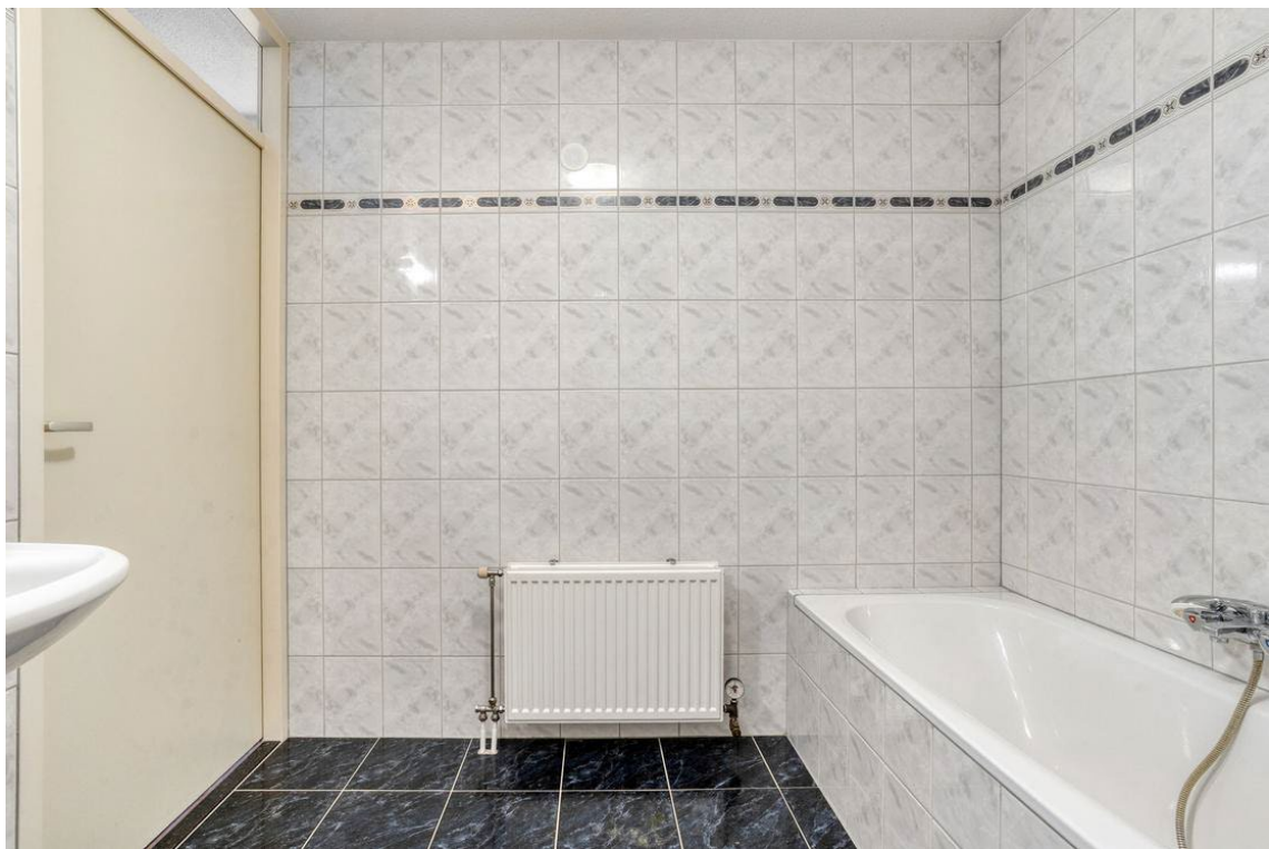
Woertheweg 3e te Hellendoorn