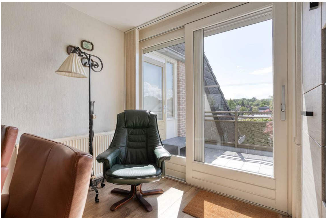
Woertheweg 3e te Hellendoorn