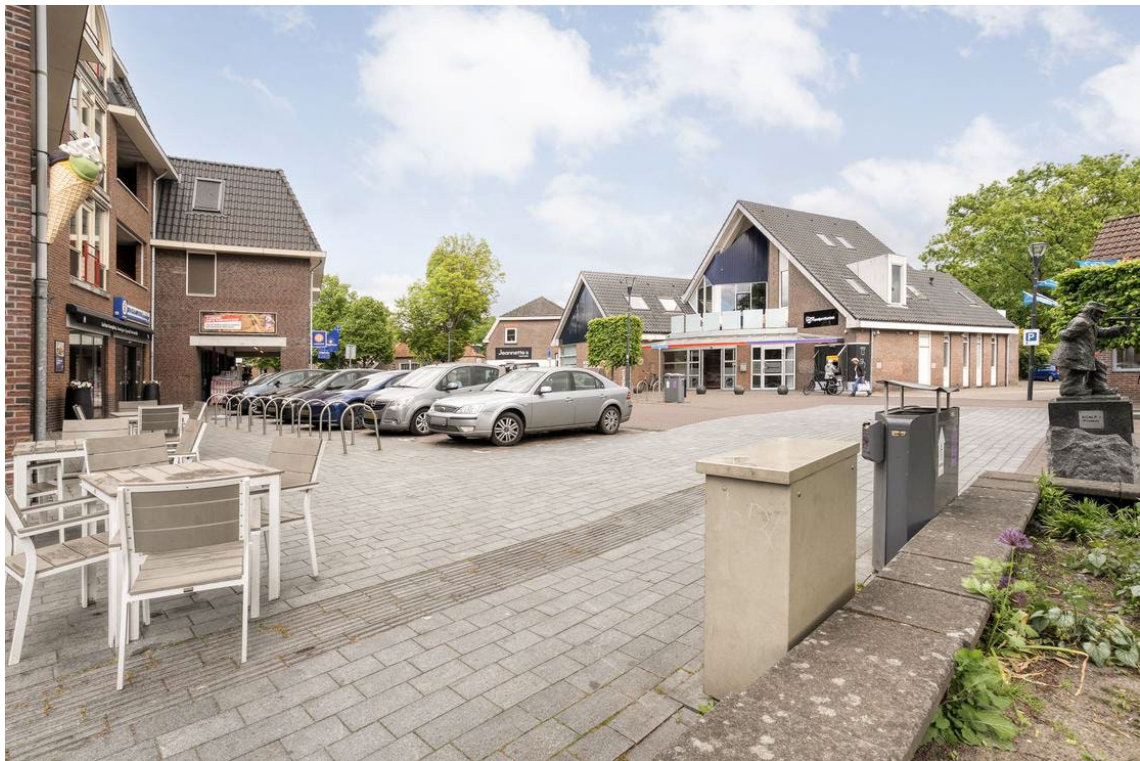
Woertheweg 3e te Hellendoorn