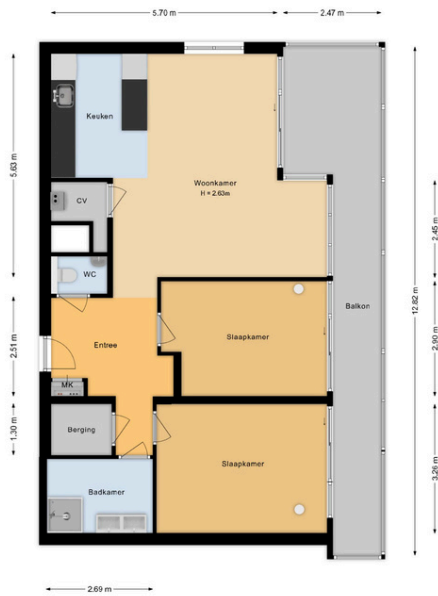
Claus Sluterweg 273 Haarlem Appartement

Deze plattegrond is met de grootst mogelijke zorg samengesteld. Desondanks kunnen er geen rechten aan worden ontleend en kunnen er kleine afwijking zijn in de exacte maatvoering. www.agvastgoedmedia.nl