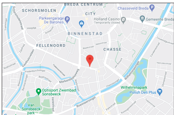
noorden kadastrale kaart