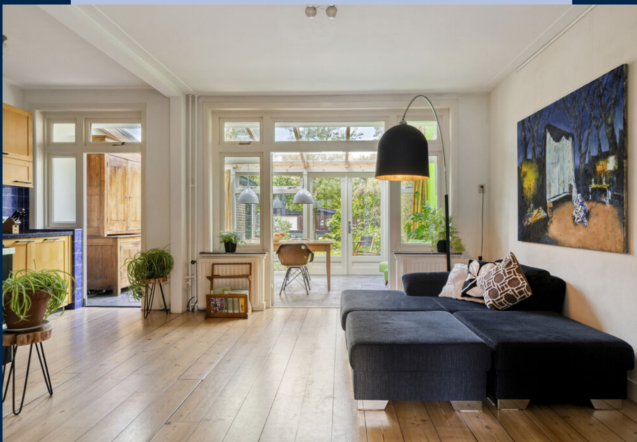
De kamer-en-suite heeft nog originele glas-in-lood schuifdeuren.