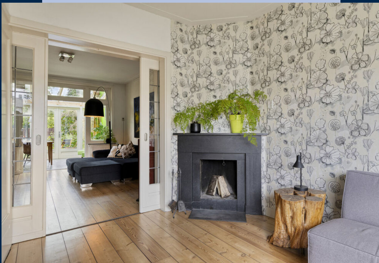
De woonkamer is v.v. van een nette houten vloer, een erker aan de voorzijde en gezellige openhaard. Middels-kamer en-suite deuren is het zitgedeelte en de open keuken bereikbaar