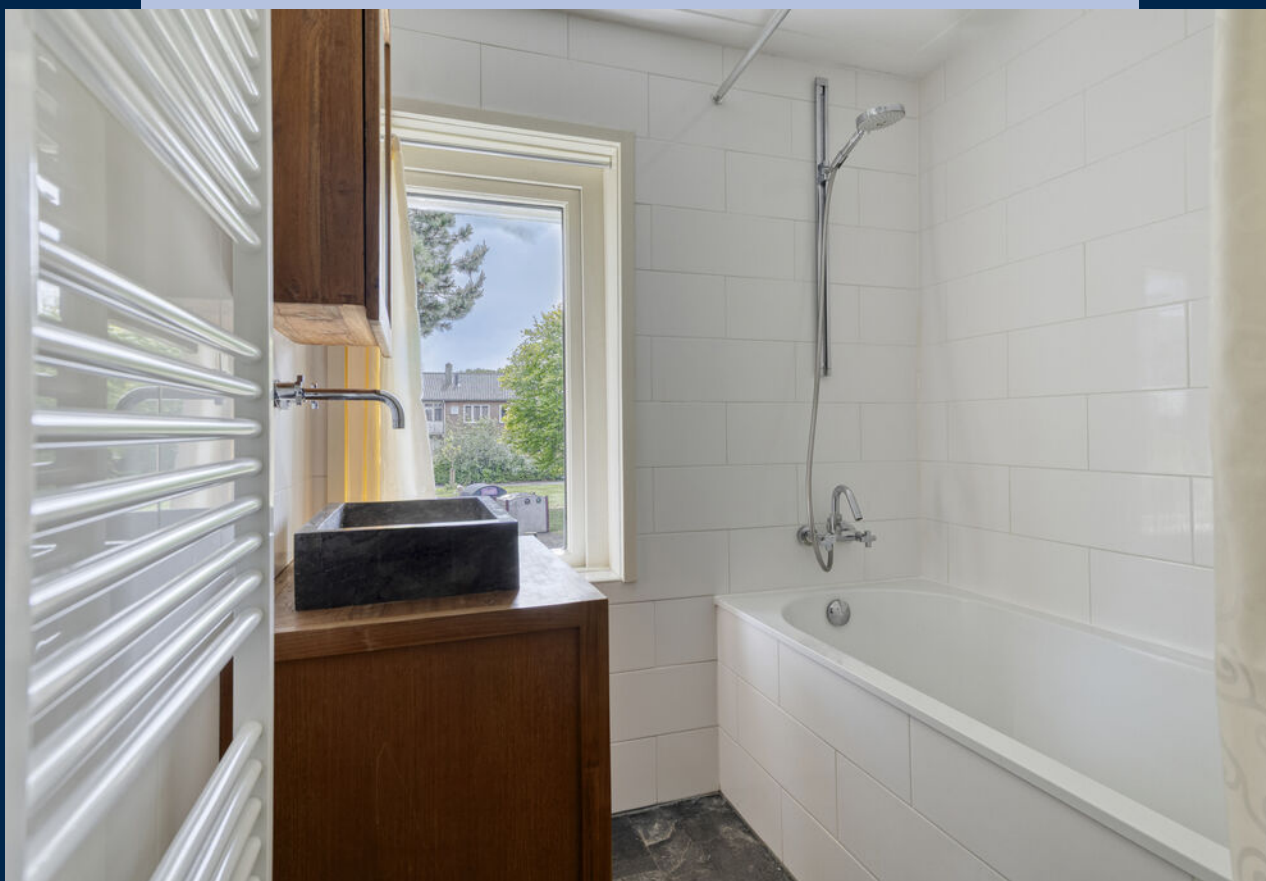
De badkamer beschikt over een bad-douchecombinatie en wastafelmeubel.