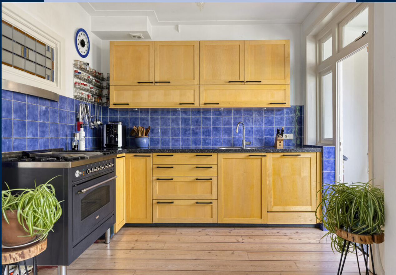
De open keuken is voorzien van een Boretti gasfornuis en vaatwasser.