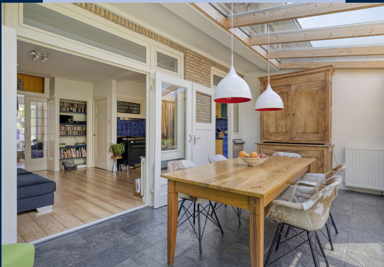
De serre is ingericht als eetkamer en dankzij de grote raampartijen en openslaande deuren een heerlijke plek met zicht op de groene achtertuin.