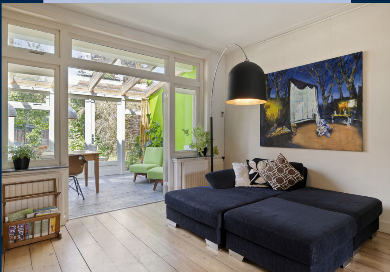
Aan de achterzijde van de woning bevindt zich de sfeervolle serre.