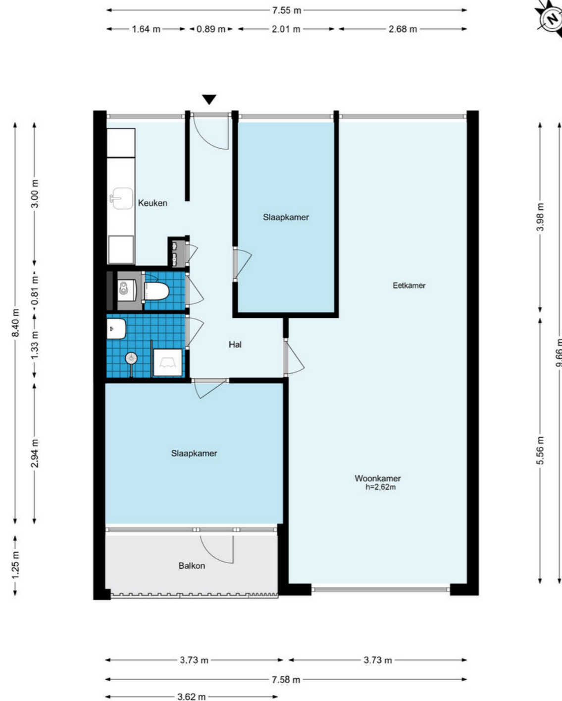
Oltmansstraat 43 - Papendrecht Appartement

De plattegronden zijn geproduceerd voor promotionele doeleinden en ter indicatie. Aan de plattegronden kunnen geen rechten worden ontleend.