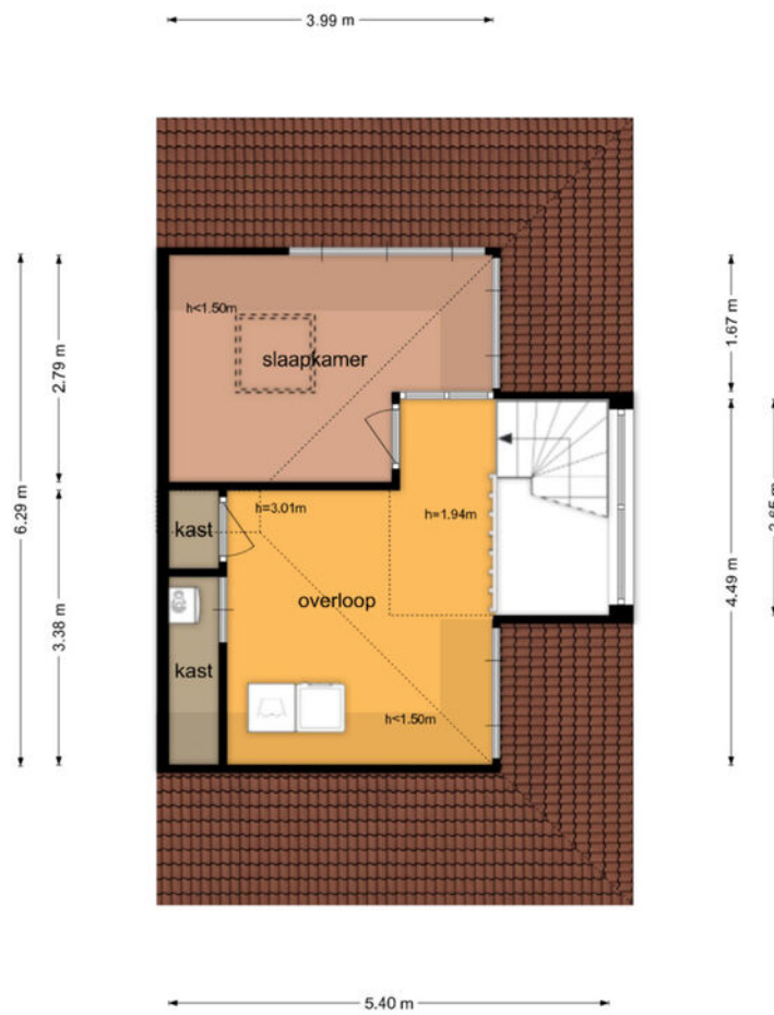
Veldbeemd 26 - De Goorn Tweede Verdieping

De plattegronden zijn geproduceerd voor promotionele doeleinden en ter indicatie. Aan de plattegronden kunnen geen rechten worden ontleend