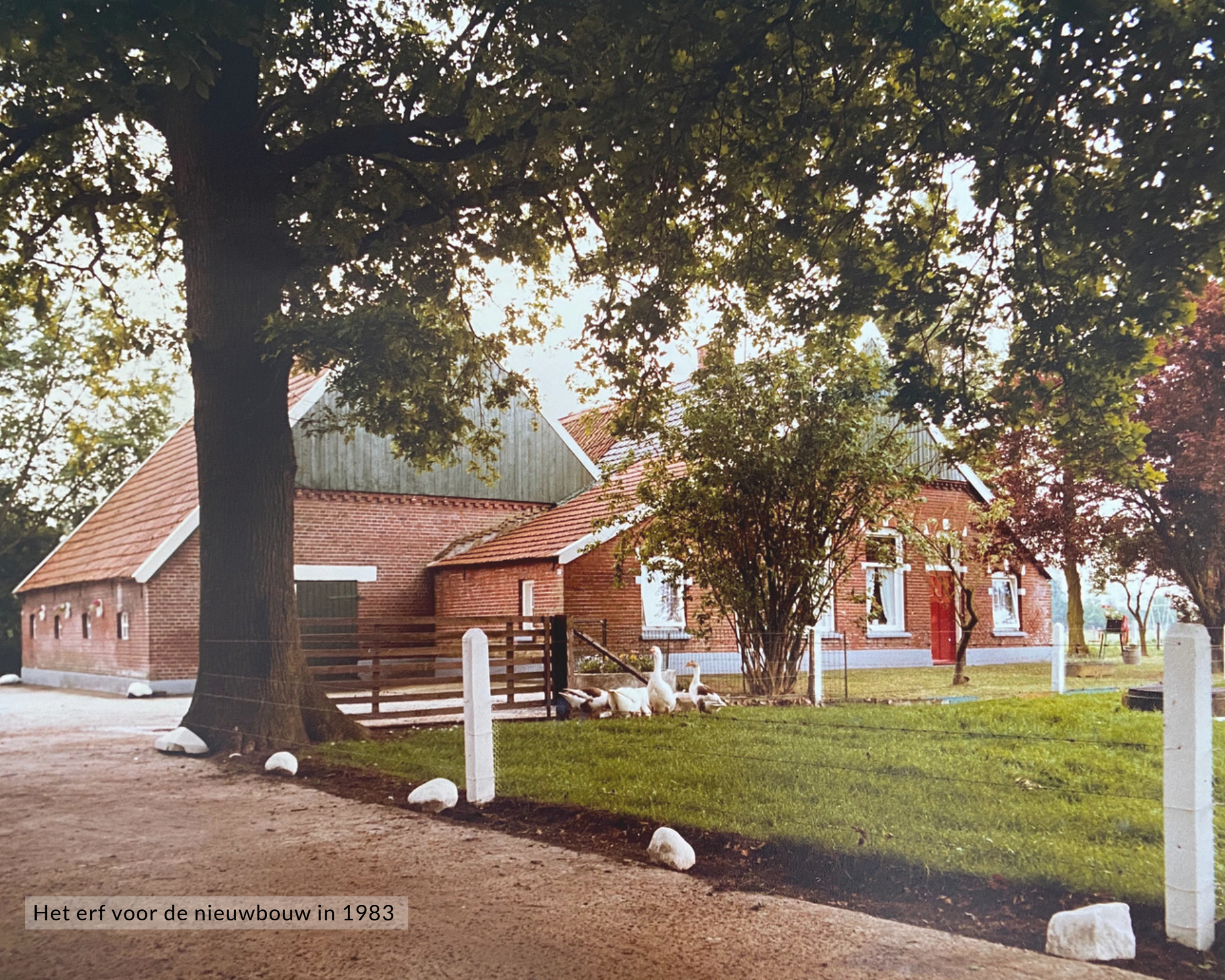
Het erf voor de nieuwbouw in 1983