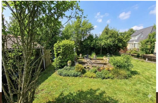
Plaswijk 29 Vinkeveen