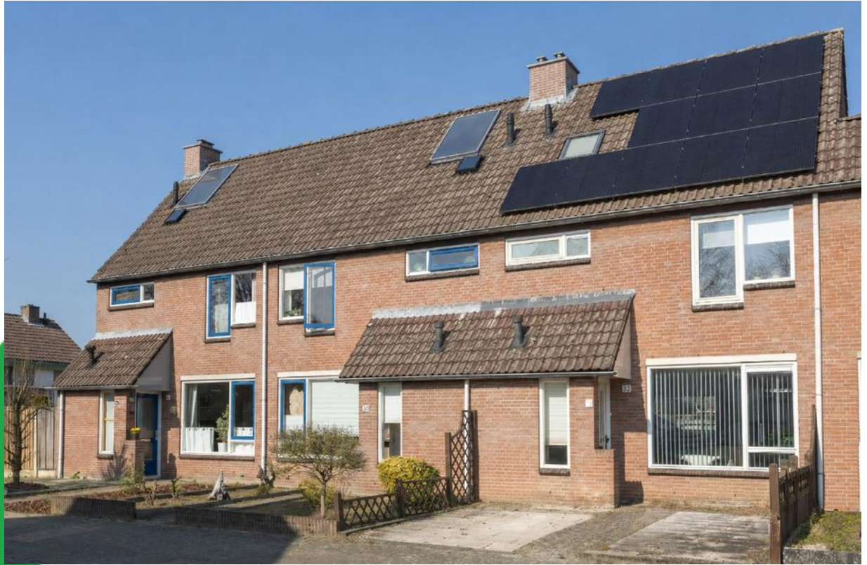
Tom Mandersstraat 69, 7558 MT Hengelo