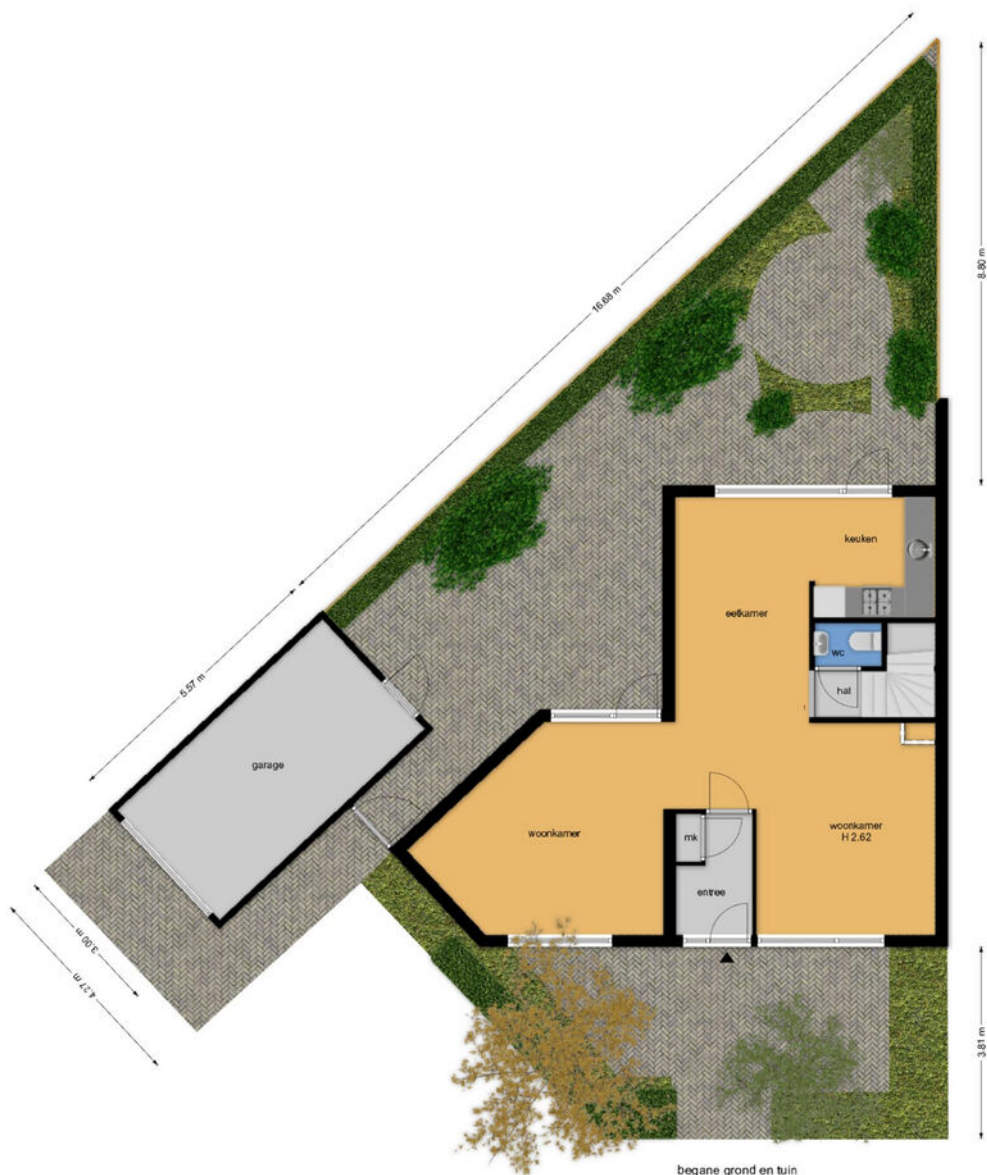
begane grond en tuin