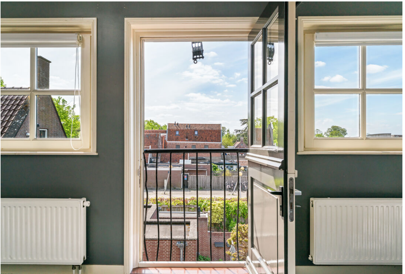
Raamstraat 4 b, Enkhuizen