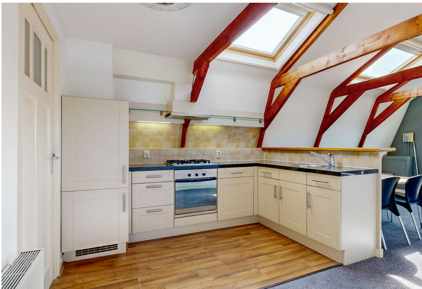
Raamstraat 4 b, Enkhuizen