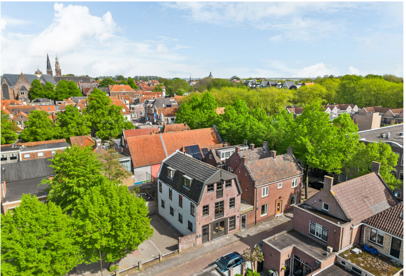
Raamstraat 4 b, Enkhuizen