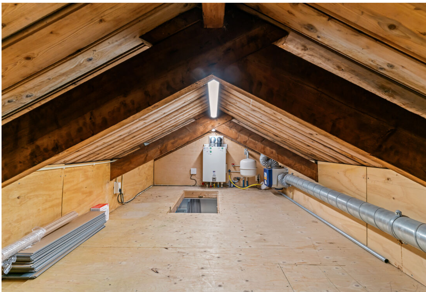
Raamstraat 4 b, Enkhuizen