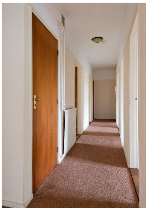
Hal en toilet