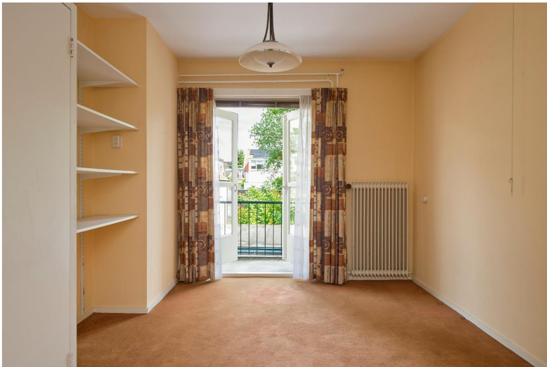
Slaapkamer 4 met balkon

Van Toulon van der Koogweg 20-1 te Oosterbeek