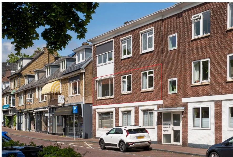
Van Toulon van der Koogweg 20-1 te Oosterbeek