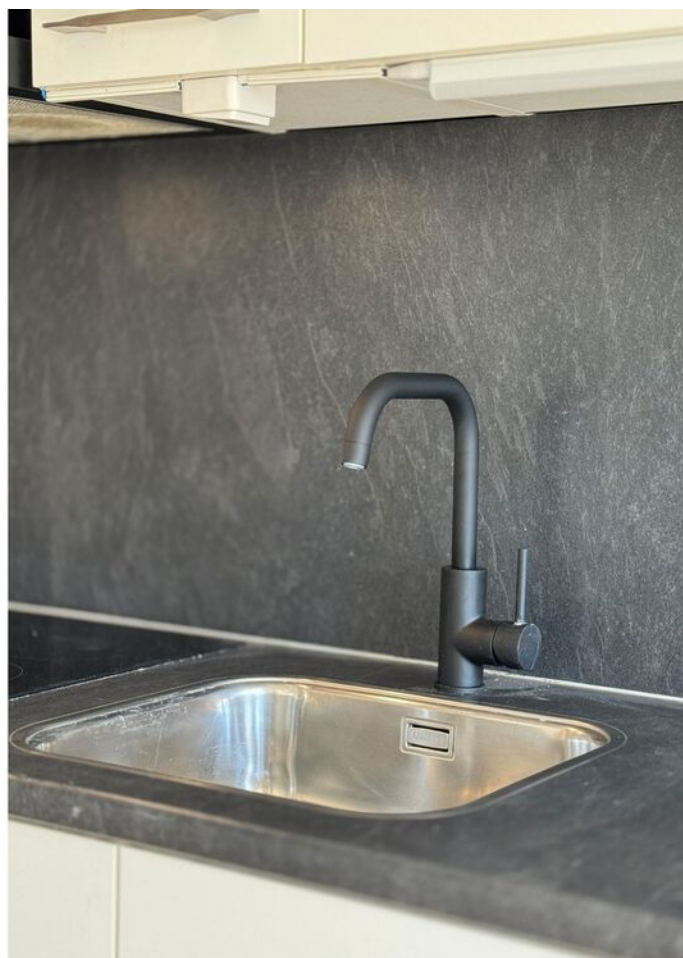
Raamstraat 4, Enkhuizen