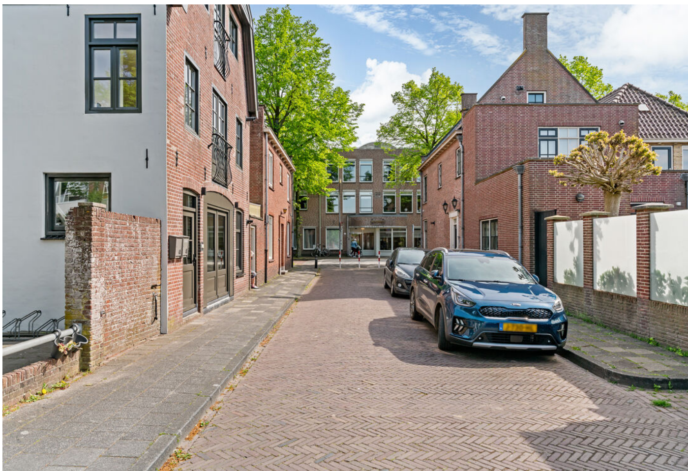
Raamstraat 4, Enkhuizen