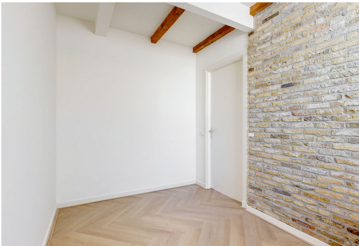
Raamstraat 4, Enkhuizen