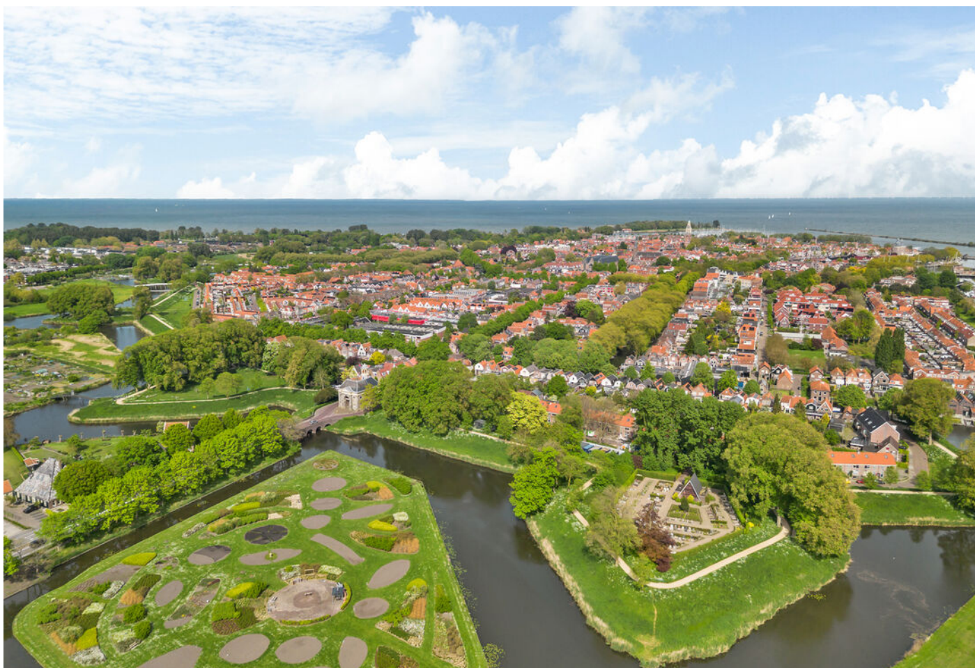
Raamstraat 4, Enkhuizen