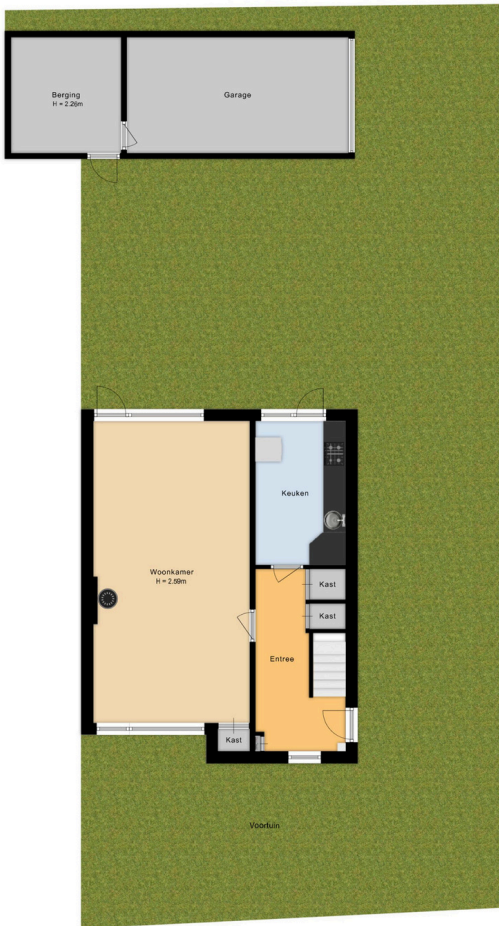
Troelstralaan 33 Heemstede Situatie

Deze plattegrond is met de grootst mogelijke zorg samengesteld. Desondanks kunnen er geen rechten aan worden ontleend en kunnen er kleine afwijking zijn in de exacte maatvoering. www.agvastgoedmedia.nl