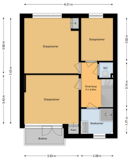
Troelstralaan 33 Heemstede 1e Verdieping

Deze plattegrond is met de grootst mogelijke zorg samengesteld.