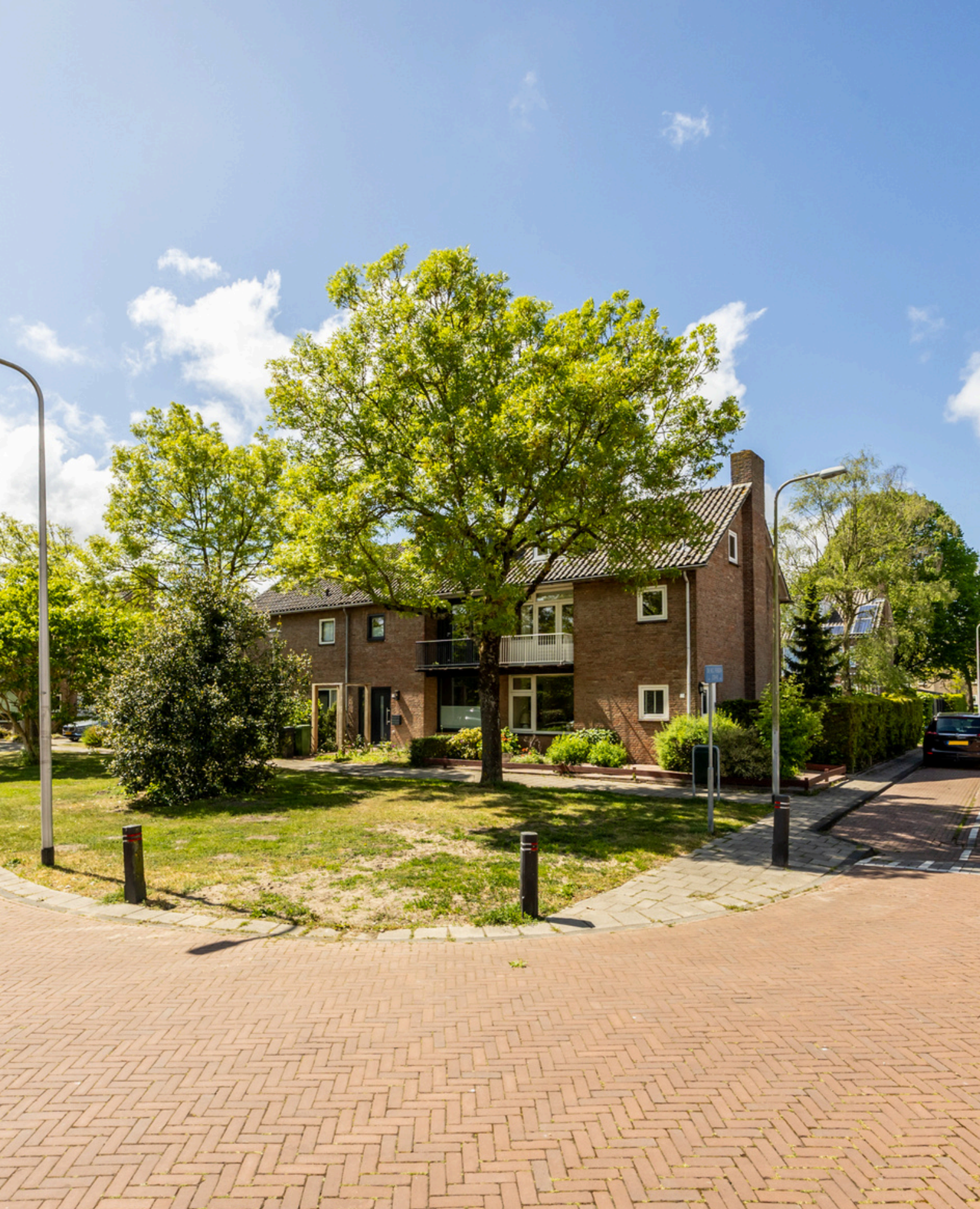
Troelstralaan 33, Heemstede