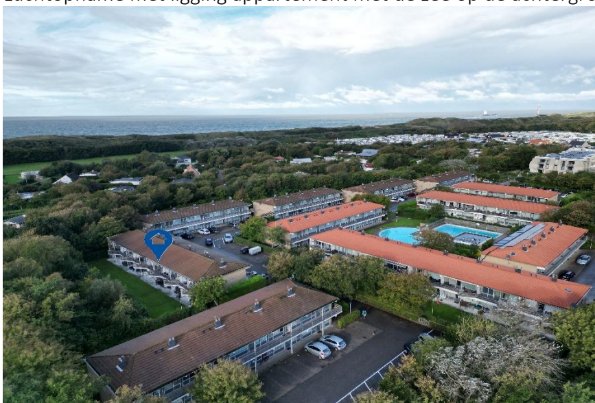
Luchtopname met de unieke ligging van het appartement.