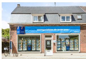
Sint-Michiëlsgestel Nieuwstraat 41a 073 - 551 00 50 infogestel@staete.nl