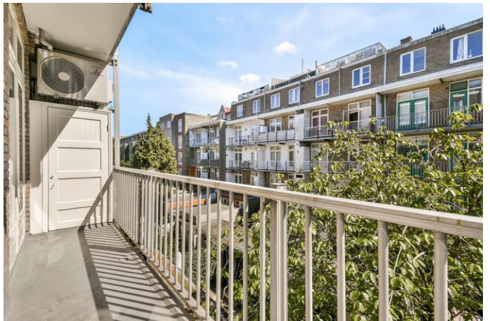
Tweede Schinkelstraat 51 2, 1075 TR Amsterdam